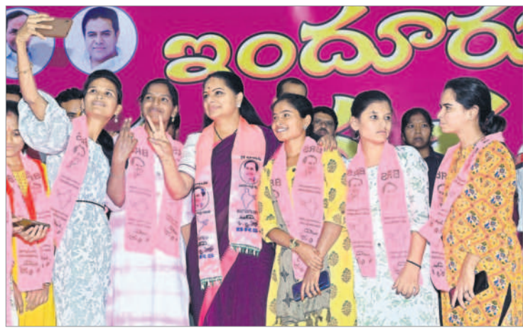
పార్టీలో చేరి ఎమ్మెల్యేతో సెల్ఫీ దిగుతున్న యువతులు