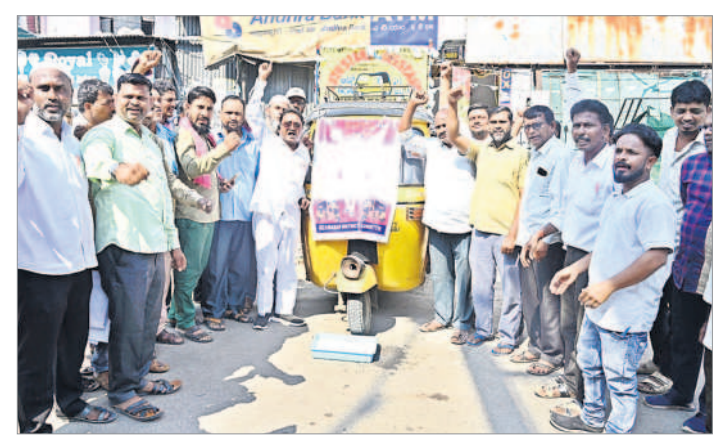
సీఎం కేసీఆర్ చిత్రపటానికి క్షీరాభిషేకం చేస్తున్న ఆటో యూనియన్ నాయకులు