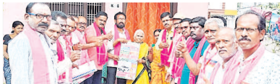
సీసీసీ సన్మాన్ : 22వ వార్డులో వృద్ధులకు మ్యూనిసిపల్ పత్రం అందజేస్తున్న నాయకులు

మంచీర్యాలటౌన్, నవంబర్ 21: తొమ్మిదేళ్లలో మంచీర్యాల నియోజకవర్గాన్ని అన్ని రంగాల్లో అభివృద్ధి చేసిన ఎమ్మెల్యే దివాలకరావునే మరోసారి గెలిపించాలని ఆయన సతీమణి రాజకుమారి ఓటర్లను కోరారు. మంగళవారం మంచీర్యాల పట్టణంలోని పాతమంచీర్యాలలో ఆమె ఇంటింటా ప్రచారం