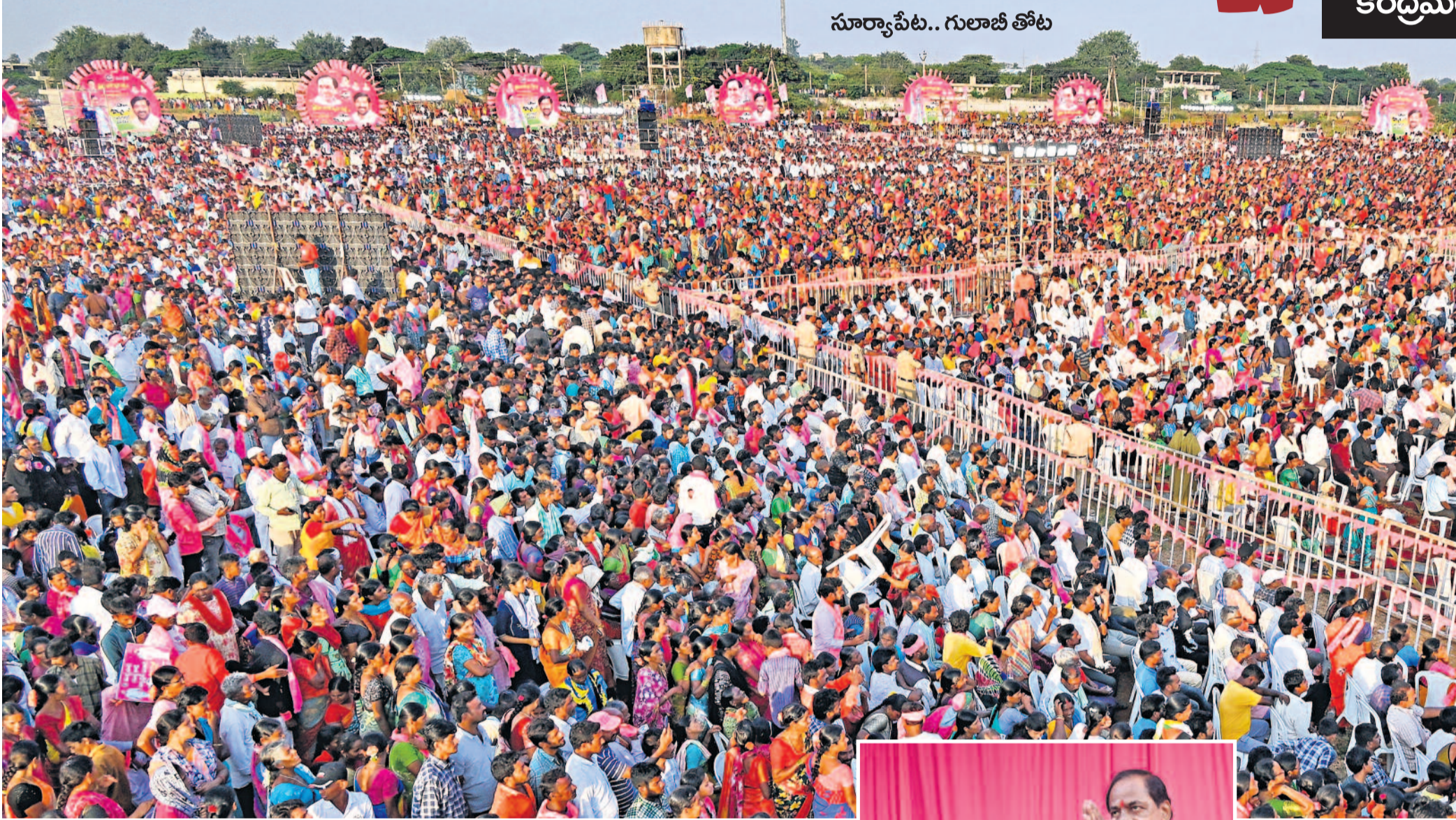
సూర్యాపేట.. గులాబీ తోట

రాష్ట్రాలకు నిధులు కావాలంటే వ్యవసాయ మోటర్లకు మీటర్లు పెట్టాలని చెప్పినం. తెలంగాణ మీటర్లు పెట్టలేదు. కానీ ఆ పాయింట్ ఆఫ్ బారోయింగ్ కూడా నాకు ఇచ్చేసేయం అంటే ఎలా? మీరు మీటర్లే ఫిక్స్ చేయనప్పుడు మీకెలా ఇస్తాం? మిగిలిన రాష్ట్రాలన్నీ వెంటనే మోటర్లకు మీటర్లు ఫిక్స్ చేసినయం. ఆ రాష్ట్రాలకు అనుమతులు కూడా వెంటనే ఇచ్చేసినం.