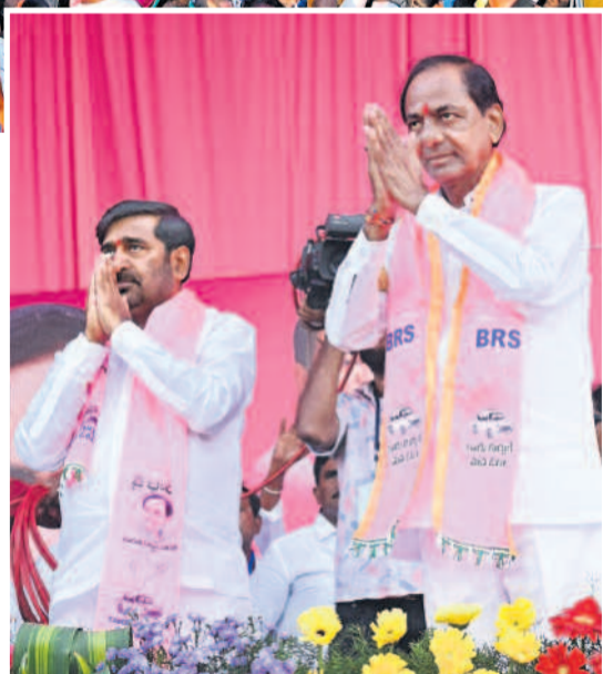
సూర్యాపేటలో జరిగిన ప్రజా ఆశీర్వాద సభకు తరలివచ్చిన అశ్వినీకామినాథ్ అధిపతి చేస్తున్న ముఖ్యమంత్రి కేసీఆర్, బీఆర్ఎస్ అధ్యక్షుడు జగదీశ్ రెడ్డి.

'చందోలికి ఎరుక గూనివాటం' అన్నట్టు మన తెలంగాణ యవ్వారం ఏంట్లో మనకు తెలుస్తది. మనం రైతాంగానికి ఉచిత కరెంటు ఇస్తున్నం. 'సూర్య కర్షణ ప్రతి బావికి, ప్రతి మోటర్ కు మీటర్లు పెట్టాలి' అని మోటి అంటుంది. 'నా ప్రాణం పోయినా నేను పెట్టను' అని చెప్పిన. అందుకు వాళ్లు ఒకటికాదు.. రెండు కాదు.. 25 వేల కోట్లు రూపాయలు మనకు రాకుండా ఆపిండ్లు. వచ్చే బడ్జెట్ కు కట్ చేసిండ్లు. ఇదే విషయాన్ని హైదరాబాద్ లో నిర్వహించిన కారామన్ మోటర్లకు మీటర్లు పెట్టాలి. - సీఎం కేసీఆర్ హైదరాబాద్, నవంబర్ 21 (నమస్తే తెలంగాణ): తెలంగాణకు కేంద్రంలోని బీజేపీ ప్రభుత్వం చేసిన, చేస్తున్న ద్రోహంపై సీఎం కేసీఆర్ చెప్పన్నట్టి నిజమని తేలింది. రైతులకు బీజేపీ, కాంగ్రెస్ పాల్లలు బద్ధ శత్రువులని, వ్యవసాయానికి ఇస్తున్న 24 గంటల ఉచిత కరెంటును ఆగం పట్టిస్తారని ఆయన చెప్పన్న హెచ్చరికలు ఆక్షర సత్యాలని తేలిపోయింది. తాము అధికారంలోకి వస్తే వ్యవసాయానికి 3 గంటల కరెంటు మాత్రమే ఇస్తామని కాంగ్రెస్ పార్టీ రాష్ట్ర హైదరాబాద్ లో నిర్వహించిన కారామన్ అధ్యక్షుడు శేవంత్ రెడ్డి బాజాపా ప్రకటించిన మోటర్లకు మీటర్లు పెట్టాలి. - 2వ పేజీలో