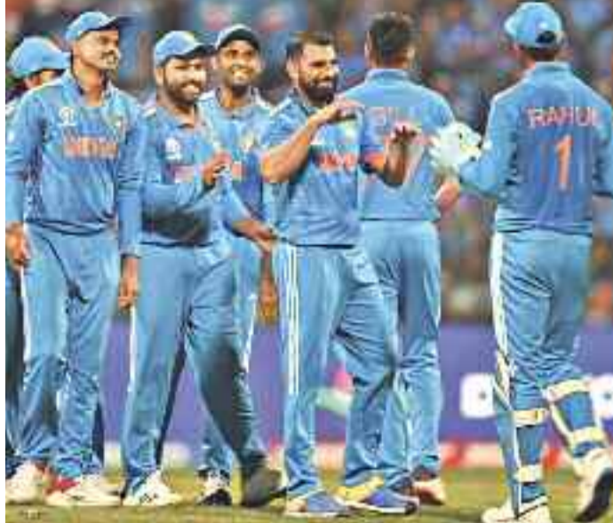
బాగుంటుంది అన్నాడు. అయితే స్టార్ క్రికెటర్లు బర్గు విరాట్ కోహ్లా, రోహిత్ శర్మ, స్టీవ్ స్మిత్, కేన్ విలియంసన్, జో రూట్, ప్యాట్ కమిన్స్ డంలో వన్డే పార్కర్ ను మించింది లేదని వంటి వాళ్ల వాదన ఇందుకు భిన్నంగా కనిపిస్తున్నది. ఓ ప్రేయరీలోని నైపుణ్యం, సహనశీలత, పట్టుదల, పోరాట పటిమను పరీక్షించడంలో వన్డే పార్కర్ ను మించింది లేదని వంటి వాళ్ల వాదన ఇందుకు భిన్నంగా కనిపిస్తున్నది.

జెంటిల్ మన్ గేమ్ గుర్తింపు తెచ్చుకున్న క్రికెట్ లో.. సుదీర్ఘ పార్కర్ తో విసిగిపోయిన సందర్భంలో వన్డేల పురుడు పోసుకున్నాయి. మొదట 80 ఓవర్లతో ప్రారంభమై.. కాలక్రమేనూ రూపాంతరం చెందుకుంటూ.. ప్రస్తుతం ఉన్న స్థితికి చేరావు. అయితే 'ముందు వచ్చిన చెవుల కన్నా వెనక వచ్చిన కొమ్ములు వాడి' అన్నట్లు.. వన్డేల తర్వాత అంతర్జాతీయ క్రికెట్ లో అడుగుపెట్టిన టీ20లు ప్రజాదరణలో దూసుకుపోతున్నాయి. ప్రజల జీవన విధానంలో మార్పులు రావడంతో పాటు.. 8 గంటలు వెచ్చించి వన్డే మ్యాచ్ చూసే సమయం అభిమానులకు సైతం లేకపోవడంతో రానున్న కాలంలో వన్డేల ప్రభావం తగ్గిపోవడం ఖాయమే అని పులుపురు అంచనాలు వేస్తున్నాయి. తాజా ప్రపంచకప్ సక్సెస్ తో నిర్వాహకులు సైతం ఆనందంగానే ఉన్నారు.. మున్ముందు మాత్రం సచిన్ టెండూల్కర్, వసీమ్ అక్రమ్ సూపర్ స్టార్లను అమలు చేయక తప్పని పరిస్థితి కనిపిస్తున్నది.