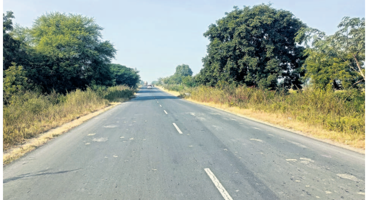
వచ్చినవేరే మనవాడయితే నగరం నడిబొడ్డున మూత్రమే కాదు, మారుమూల కుగ్రామంలోనూ అభివృద్ధి అప్రతిహతంగా సాగుతుందనడానికి ఈ చిత్రం సాక్ష్యం.