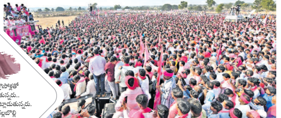
దౌలాబాద్ బీఆర్ఎస్ యువగర్జన సభకు భారీగా తరలివచ్చిన ప్రజలు