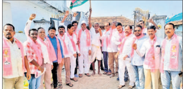
అందోల్ : అందోల్ -జోగిపేటలో ఇంటింటి ప్రచారం చేస్తున్న నాయకులు