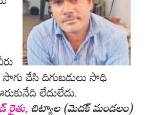
- యాదగిరి రైతు, బిల్కూల (మెడక్ మండలం)

రైతన్న బాగుంటేనే దేశం బాగుంటుంది.. ఇది కేసీఆర్ సార్ కు తెలుసు అందుకే అన్ని తీర్ల అదుకుంటున్నాడు. తెలంగాణ కరెంటు బతుక్కం 24 గంటల కరెంటు ఇవ్వడం వల్లే పంటలు బాగా పండుతున్నాయి. ఏ మేరకు నీరు అవసరమో ఆ మేరకు పంటలు సాగు చేసి దిగుబడులు సాధిస్తున్నాం. కరెంటు కేటీఆర్ ఇచ్చిన తరువాత లేదు లేదు.