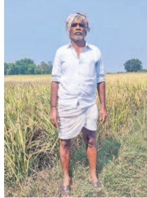
- సిదాల నర్సంపాలు, రైతు, బహిరంగదెబ్బ, అల్లూరుగల్లం

కాంగ్రెస్ పార్టీ ధరణి తీసేస్తమంటున్న రంట. గా.. ధరణి వచ్చిన సంది ఒక్క దగ్గరే రిజిస్ట్రేషన్, మ్యూటీషన్ అయిపోతున్నది. రైతులకు సర్కారు ఆఫీసులు చుట్టూ తిరుగుడు తప్పింది. ధరణి రద్దు చేస్తే రైతులు శానా గోస పడ్డారు. దినాం రిజిస్ట్రేషన్ ఆఫీసుల చుట్టూ తిరుగాలే.. గండుకే కేటీఆర్ సార్ రైతులు కష్టాలు తెలిశే.. ధరణి తెచ్చింది. మల్ల గిట్లా కాంగ్రెస్ సర్కారు వస్తే రైతుల తిప్పలు మల్ల పురు అవుతాయి. మల్ల పబ్లిక్, పట్టణాల కాలం వద్దు. గాకతో ఏం పని. ధరణి వచ్చినంతే శానా మంది కష్టాలు తీరినయ్యే.