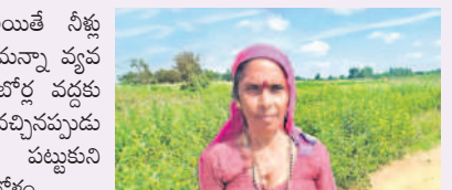
- అంబాటి, సుగుణ గిరిజన తండా, రామాయంపేట

గొప్పట్లు అయితే నీళ్ళ తాగుదామన్నా వ్యవసాయ బోర్డర్ వద్దకు కరెంటు వచ్చినప్పుడు బిందెలు చుట్టుకుని ఎగబడేటోళ్ళం. అయినా నీళ్ళ దొరకక చానా ఇబ్బందిపడ్డం. ఏ రాత్రి కరెంటు వచ్చినా ఆ రాత్రి నీళ్ళ కోసం పోయేటోళ్ళం. పిల్లలకు కూడా చెంబులిచ్చి నీళ్ళ పట్టుకుని వస్తేటోళ్ళం. ఇన్ని కష్టాలు పడ్డ మాకు తెలంగాణకు సేవిగా కేసీఆర్ వచ్చిందంటే మా బాధ అల్పి తీరినయి. లేకుంటే ఇప్పటికైనా గొప్పట్లనే ఉండేటోళ్ళమేమో. ఇంటింటికీ నల్ల నీళ్ళ వస్తున్నయే. వాటినే తాగుతున్నం. మల్ల లేని పోని ఆశలు చూపుతున్న కాంగ్రెస్ పార్టీ ఏమీ చేయరు. వారున్నప్పుడే వడ్డం ఇవ్వగోసలు. ఇంకా గోసలు వడ్డమా. మాకు వాల్చర్లు వాల్చర్లు వచ్చేమెంటు అయ్యి. మాకు మా కేటీఆర్ లేదు లేదు లేదు.