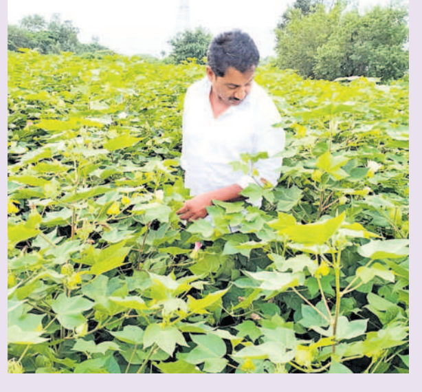
-చండ్రవరెడ్డి, చందూర్, (బిలిపెనెడ మండలం)

ప్రభుత్వం అమలు చేస్తున్న 24 గంటల ఉచిత విద్యుత్తో మేలు జరుగుతున్నది. భూమి విస్తీర్ణం ఎక్కువ ఉన్నా కూడా మాకు 10 హెచ్పీ మోటార్ అవసరం రాలేదు. గతంలో కరెంటు సమస్య, నీటి సమస్యతో పంటలు పండక అప్పులే మిగలేవి. తెలంగాణ వచ్చాక దిగుబడులు పెరిగి, ఆర్థికంగా నిలదొక్కుకున్నాం. ఈ ఏడాది వరి,పత్తి మంచిగా పండినవి. కాంగ్రెస్ లో 3 గంటల కరెంటు, 10 హెచ్పీ మోటార్లు పెట్టుమనడం చాలా బాధకారం. మళ్ళీ తెలంగాణ వందేళ్ల వెనక్కి పోతది. రాత్రిలో మోటార్ల దగ్గర ఉండి పరిస్థితి వస్తుంది.