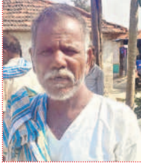
- పిట్ట పాపయ్య, మక్కలకామ్రాద్, పెద్దకలకరంపేట

ధరణి పోర్టల్ తోనే రైతులకు మేలు జరిగింది. భూ రికార్డులకు భద్రత కలిగింది. కాంగ్రెస్ ధరణిని తీసిస్తాననడం మూర్ఖత్వం. ధరణితో భూముల హక్కులపై దళారుల పెత్తనం పూర్తిగా తొలిగిపోయింది. లంచాల బాధపోయింది. రెవెన్యూ వ్యవస్థలో ప్రకాశన జరిగి వేలిముద్రల సాయంతో క్రయ విక్రయాలు జరుగుతున్నాయి. మ్యూటీషన్ కూడా వెంటనే ఇస్తున్నారు.