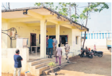
తాండూర్ మహాశ్వల జిన్నింగ్ మిల్లో సోదాలు చేస్తున్న ఐటీ అధికారులు

- మంచెర్యాల, నవంబర్ 21 (నమస్తే తెలంగాణ ప్రతినిధి)