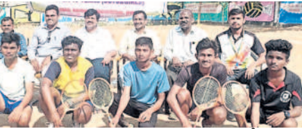
రాష్ట్ర స్థాయి బాల్ బ్యాడ్మింటన్ ఎంపికైన ఉమ్మడి ఆదిలాబాద్ జిల్లా క్రీడాకారులు