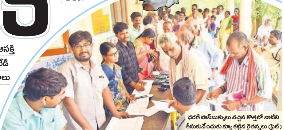
ధరణి పానీబుక్కులు వచ్చిన కొత్తలో వాటిని తీసుకునేందుకు క్యూ కట్టిన రైతన్నలు (ఫైల్)