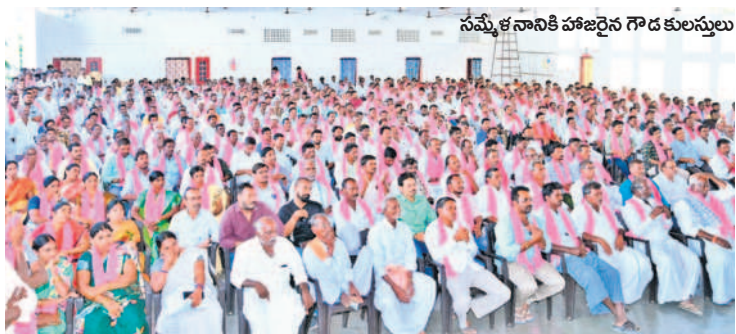
సమ్మేళనానికి హాజరైన గౌడ కులస్తులు