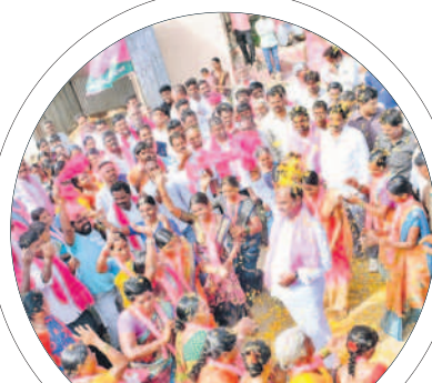
జిల్లడబందలో రాములక్క పాటకు మహిళలతో కలిసి స్టెప్పిలేస్తున్న ఎమ్మెల్యే

అభివృద్ధిని ప్రజలకు తెలియజేయాలని డిమాండ్ చేశారు. నడిగడ్డలో కులాల మధ్య చిచ్చుపెట్టేందుకు ఇక్కడి కాంగ్రెస్ అభ్యర్థి కుట్రలు చేస్తుందని.. తిప్పి కొట్టాల్సిన అవసరం ప్రజలపైనే ఉందన్నారు. గద్వాలను అభివృద్ధి చేసే వ్యక్తి కావాలా.. ప్రజల మధ్య అలజడులు సృష్టించే వ్యక్తులు కావాలో ప్రజలు ఆలోచించి ఓటు వేయాలని సూచించారు. కాంగ్రెస్ అభ్యర్థి మాటలతో గద్వాలలోని వ్యాపారులు, ప్రజలు భయాందోళనకు గురవుతున్నారని, పాత కక్షలు, కుటుంబ సమస్యలను పార్టీ గొడవలుగా చిత్రీకరించడం ఆమెకి చెల్లించడం.. ఈనెల 30వ తేదీ తర్వాత ఎవరు మూటాముల్లే సర్దుకొని, నోరు మూసుకొని బిహాణ ఎత్తుతారో తెలుస్తుందన్నారు. ఓడిపోతామని తెలిసి రెచ్చగొట్టే