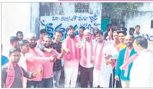
నిర్మల్ టౌన్ : ప్రచారంలో పాల్గొన్న రిజ్యూన్, నాయకులు