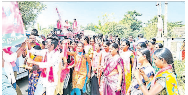
దిలావర్పూర్ : మంత్రి ప్రచారంలో పాల్గొన్న మహిళలు, గ్రామస్థులు