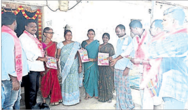
మామడ : న్యూలింగంపల్లిలో ప్రచారం నిర్వహిస్తున్న నాయకులు