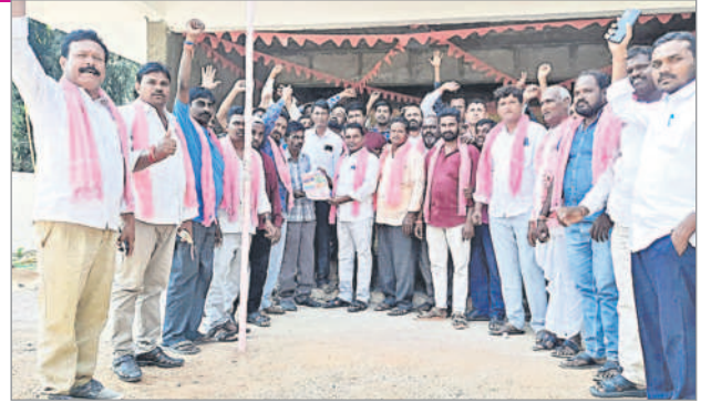
నర్సాపూర్(జి) : ప్రచారం నిర్వహిస్తున్న బీఆర్ఎస్ నాయకులు