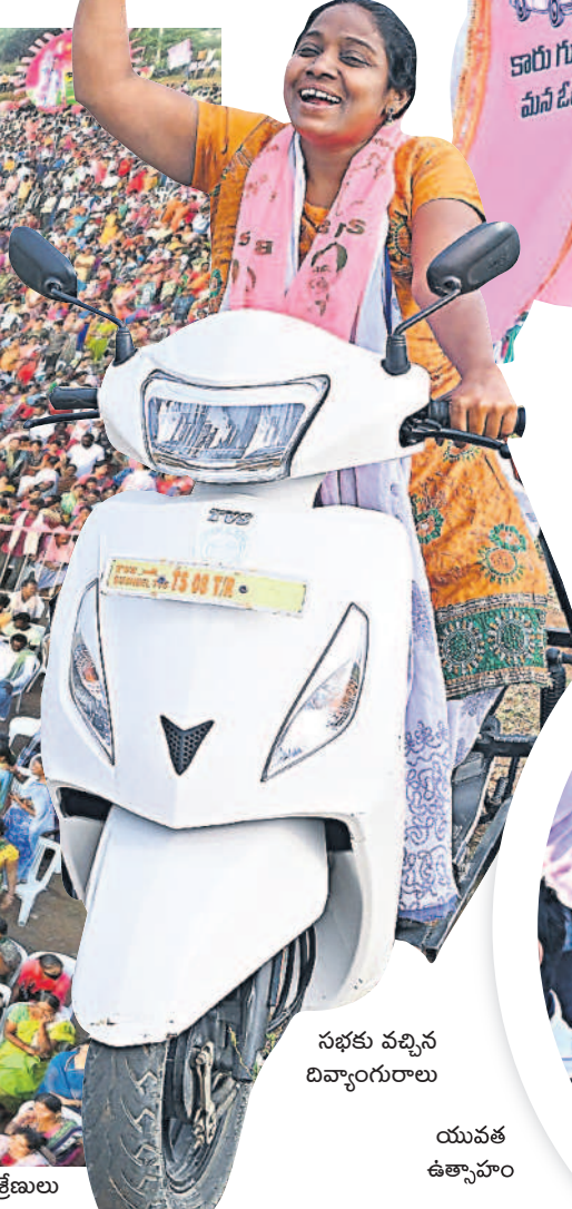
సభకు వచ్చిన డివ్యాంగురాలు