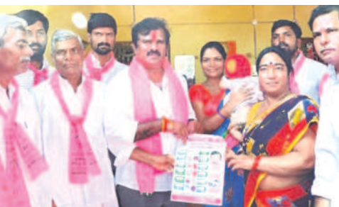
శాఫూర్లో ప్రచారం చేస్తున్న అందోల్ ఎమ్మెల్యే చంటి క్రాంతిరణ్