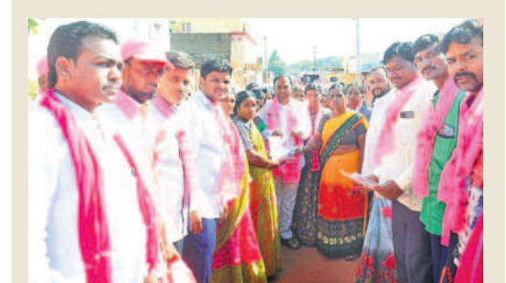
జహీరాబాద్ లోని హమాల్ కాలనీలో ఓట్లు వేయాలని మహిళలను కోరుతున్న ఎమ్మెల్యే, బీఆర్ఎస్ అభ్యర్థి మారణిక్కరావు, బీఆర్ఎస్ నాయకులు