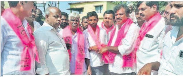
సీరూర్లో బీఆర్ఎస్లో చేరుతున్న సింగితం గ్రామానికి చెందిన కాంగ్రెస్ నాయకులు