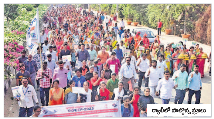
ర్యాలీలో పాల్గొన్న ప్రజలు