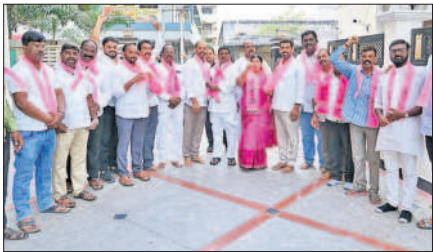
రామచంద్రాపురం : ఎమ్మెల్యే సమక్షంలో బీఆర్ఎస్లో చేరుతున్న ఆర్పిపురం బీజేపీ నాయకులు