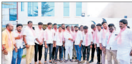
గుమ్మడిదల : ఎమ్మెల్యే సమక్షంలో బీఆర్ఎస్ లో చేరుతున్న ఇతర పార్టీ నాయకులు