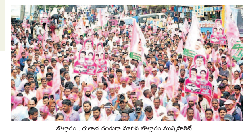
బొల్లారం : గులాబీ దండుగా మారిన బొల్లారం మున్సిపాలిటీ