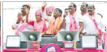
బొల్లారం : రోడ్ షోలో ప్రజలకు అభివాదం చేస్తున్న ఎమ్మెల్యే గూడెం మహిపాల్ రెడ్డి