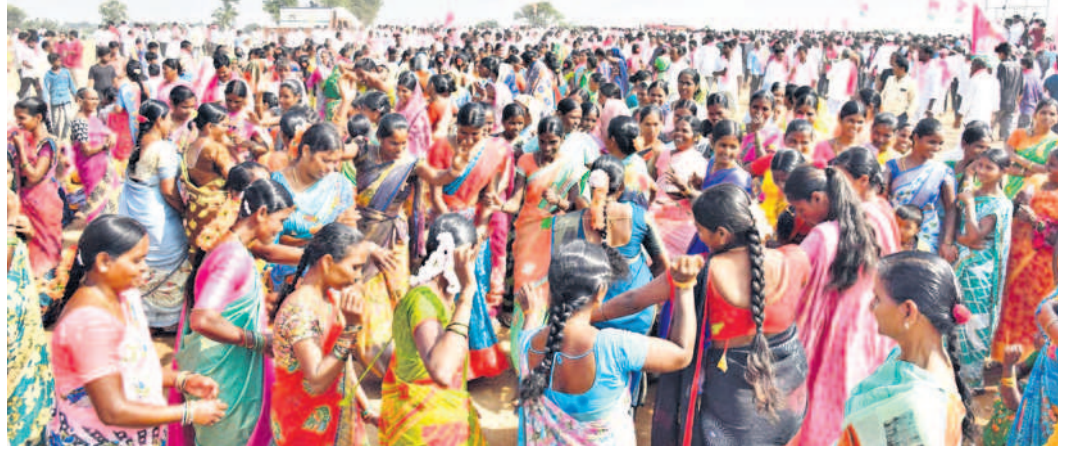
దౌల్తాబాద్ బీఆర్ఎస్ యువగర్జన సభలో బతుకమ్మ ఆడుతున్న మహిళలు