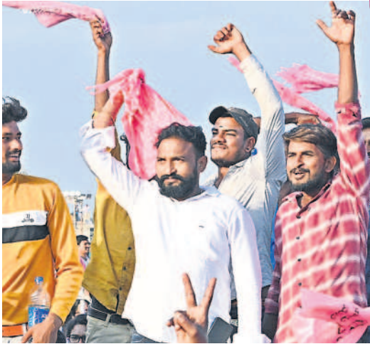
సభలో యువకుల జోష్