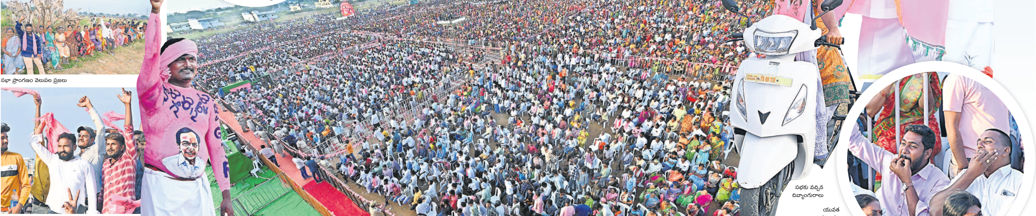
సభా ప్రాంగణం వెలువల ప్రజలు