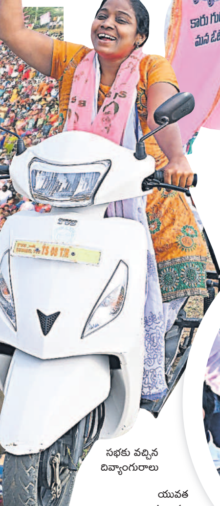
సభకు వచ్చిన టివ్యాంగురాలు