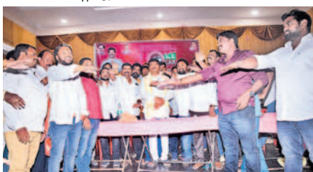
ప్రతిజ్ఞ చేస్తున్న నాయిత్రాహ్మణ సంఘం సభ్యులు