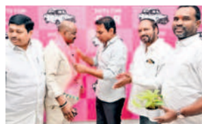
శ్రీహరిని ఆహ్వానిస్తున్న మంత్రి కేటీఆర్