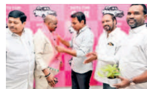
శ్రీహరిని ఆహ్వానిస్తున్న మంత్రి కేటీఆర్