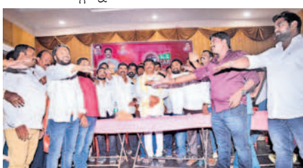
ప్రతిజ్ఞ చేస్తున్న నాయిత్రాహ్మణ సంఘం సభ్యులు