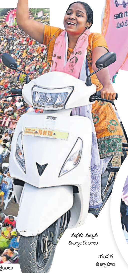
సభకు వచ్చిన డివ్యాంగురాలు