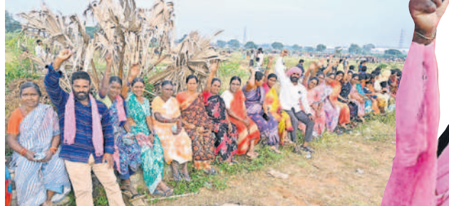
సభా ప్రాంగణం వెలువల ప్రజలు