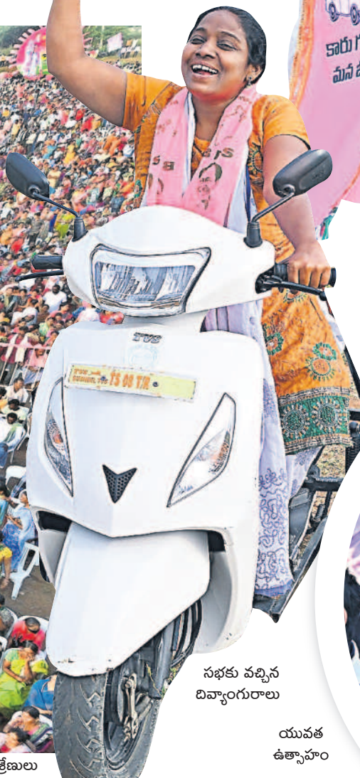
సభకు వచ్చిన డివ్యాంగురాలు