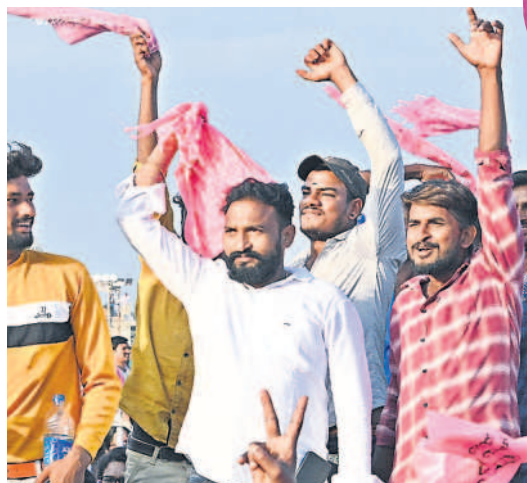
సభలో యువకుల జోష్