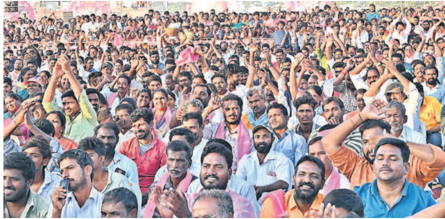
ప్రజా ఆశీర్వాద సభలో సీఎం కేసీఆర్ ప్రసంగానికి చప్పట్లతో మద్దతు తెలుపుతున్న జనం