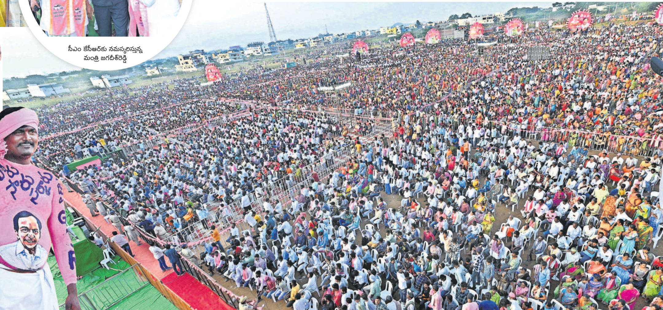
సూర్యాపేటలో బీఆర్ఎస్ ప్రజా ఆశీర్వాద సభకు భారీగా హాజరైన జనం, పార్టీ శ్రేణులు