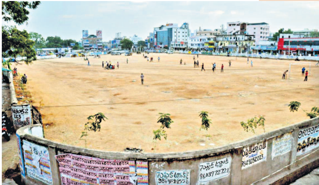
కరంనగర్ నగరీకాండ్లను ఉన్న నర్సరీ గ్రౌండ్ తెలంగాణ రాజకీయం నిరుపయోగంగా ఉండేది. అప్పుడున్నా క్రికెట్ బోర్డుమెంట్ కు వేదికయ్యేది. ఎప్పుడో ఒకసారి ఎగ్జిబిషన్లు జరిగేవి. మైదానం చుట్టూ చెత్త వేలి దుర్వాసన వచ్చేది. బీకటి పడిందంటే చాలు తాగుబోతులు, అసాంఘిక శక్తులకు అడ్డాగా మారేది. వగటి పూట కూడా పెద్దలు, మహిళలు ఈ మైదానం వైపు కన్నెత్తి మానేవారు కాదు. పిట్ట గోడమీద చేరిన అల్లరి మూకలు వచ్చిపోయేవారిని అటకాయించేవారు.