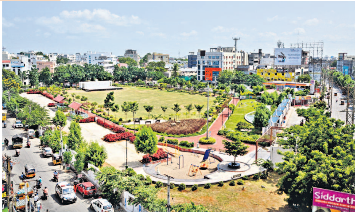
కేసీఆర్ ముఖ్యమంత్రి అయ్యాక కరంనగర్ నర్సరీ గ్రౌండ్ కి కొత్తరూపు వచ్చింది. రూ.9.50 కోట్ల వ్యయంతో ఉద్యానవనంగా తీర్చిదిద్దారు. ఆట వస్తువులు, సింథటిక్ వాకింగ్ ట్రాక్, బెంబీలు, యోగాసెంటర్, మహిళలు, పురుషులకు వేర్వేరుగా టాయిలెట్స్ నిర్మించారు. సాంస్కృతిక ప్రదర్శనల కోసం వేదిక ఏర్పాటు చేశారు. ఇప్పుడు ఉభయ సందర్భాల్లో సగరవాసులు గ్రౌండ్ లో వాకింగ్ చేస్తున్నారు. సాయంత్రం పూట పిల్లలతో వచ్చి కాలక్షేపం చేస్తున్నారు.

ఫన్ టాస్టిక్ ఉచిత గాలి... కమిలం హామీ! మోడి పాల్ ఆలోచనల్లో పడిపోయారు. అదానీ ఏమీ కాదు ఎందుకు దిగులు అని అక్కడున్న వాళ్ల వీళ్లకి వినిపించేట్టుగానే అన్నారు. మీరెప్పుడూ అదానీ వెనుక, ముందు ఉన్న తరువాత ఏమవుతుంది అని అనునయించారు. 'మా దిగులు అది కాదు. ఐదు రాష్ట్రాల్లో ఎన్నికలు. తెలంగాణలో పాత రికార్డులు బద్దలు కొట్టేట్టుగా ఉన్నాయి.' 'అంటే గెలుస్తావా?' 'ఏ లోకంలో ఉన్నావన్నీ? రికార్డులు బద్దలు కొట్టడం అంటే గత ఎన్నికల్లో తెలంగాణలో 105 చోట్ల డిమాండ్లు పోయాయి. ఈ సారి మన రికార్డును మనమే బద్దలు కొడతామేమో అనిపిస్తున్నది.' 'జనాలను ఆకట్టుకునే విధంగా కొత్త హామీలు ఏమీ డామా? అని ఆలోచిస్తున్నాం. మీకూ ఏమైనా తడితే చెప్పండి...' అని పా అడిగారు. 'బొందితో స్వర్గానికి... అంటే ఎలా ఉంటుంది?' 'కరెన్సీ రద్దు సమయంలో జనాలకు బతికి ఉండగానే నరకం చూపింది, 50 రోజులు ఓపిక వదిలి స్వర్గం చూస్తారు అని హామీ ఇచ్చాం. ఈ డిమాండ్ తీరుతుంటే... మననే గెలిపిస్తారు... అంటూ ఉత్సాహంగా పాను కొగిలించుకున్నారు. అధికారంలోకి వచ్చినప్పటి నుంచి జనం గిల గిలా కొట్టుకుంటున్నట్లు చెప్పాం.' 'మీ మనసులో ఏమంటో నాకు తెలుసు. గిలగిలా కొట్టుకోవడమే కాదు, మనం తప్ప మరో మార్గం లేదని ఒప్పుకుంటారు. అలాంటి హామీ' అని చెప్పకొచ్చారు. ఏమిటో ఆ హామీ... 'మరిన్ని రేషన్ బియ్యం, పెన్షన్, రైతుబంధు, కల్యాణశ్రీ ఇవేమీ లేక పోయినా బతుకుతామో' అని మోడి చెబితే... అంతా ఔను అన్నారు. 'కానీ, గాలి లేనిదే మనిషి బతుకకదు. మనం కొలువైన ఢిల్లీలో కాలవ్యం చూశాక నాకో ఐడియా వచ్చింది. గాలి