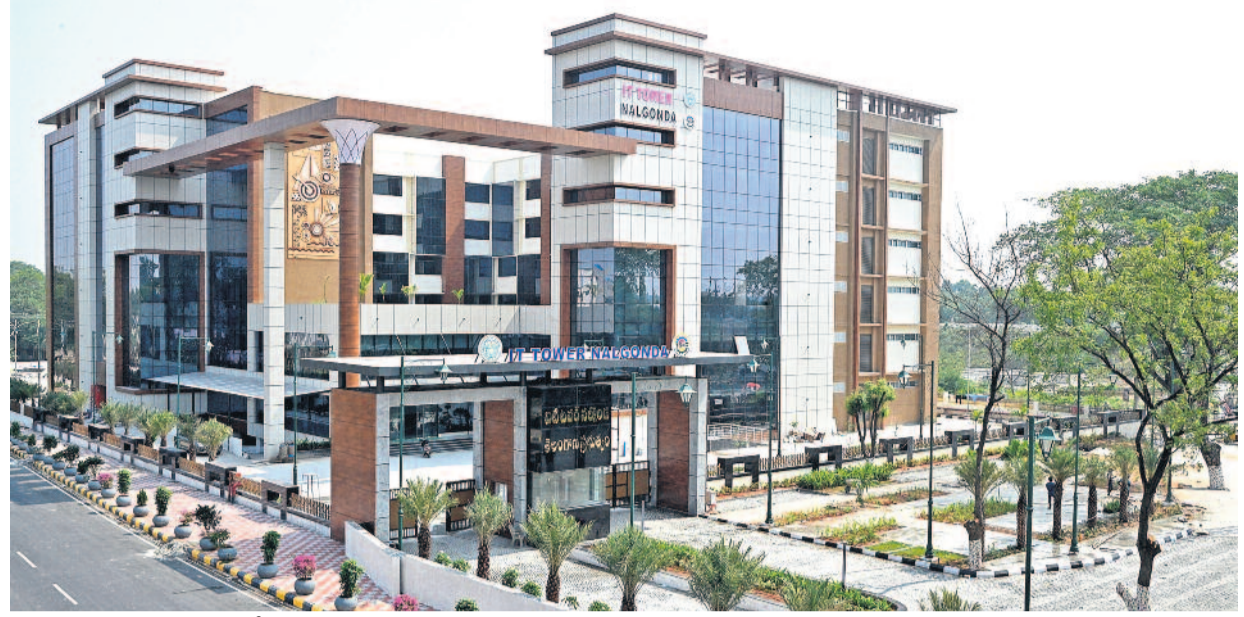
నల్లగొండలో నిర్మించిన వటి టవర్