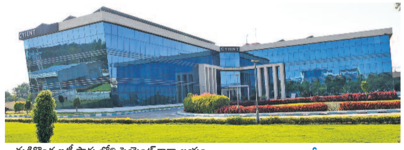
మడికొండ ఐటీ పార్కులోని సైబెంట్ కార్యాలయం

సాఫ్ట్వేర్ ఉద్యోగం అంటే హైదరాబాద్, బెంగళూరుతో పాటు ఇతర పెద్ద పట్టణాలు, విదేశాల్లో మాత్రమే అందుబాటులో ఉండేవి. కానీ.. తెలంగాణ నిర్మించిన తర్వాత పరిస్థితులు పూర్తిగా మారిపోయాయి. సీఎం కేసీఆర్, ఐటీ మంత్రి కేటీఆర్ చొరవతో జిల్లా కేంద్రాల్లో సైతం ఐటీ టవర్ల నిర్మాణంతో సాఫ్ట్వేర్ కొలువులు అందుబాటులోకి వచ్చాయి. అమ్మనాన్నలకు, ఇంటి వాతావరణానికి దూరంగా ఉంటూ ఉన్నత పదువులు చదివిన యువతకు మన దగ్గర ఐటీ కొలువులు దొరుకుతుండటంతో వారు హర్షం వ్యక్తం చేస్తున్నారు.