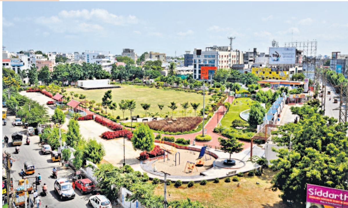
కేసీఆర్ ముఖ్యమంత్రి అయ్యాక కరంనగర్ నర్సరీ గ్రౌండ్ కి కొత్తరూపు వచ్చింది. రూ.9.50 కోట్ల వ్యయంతో ఉద్యానవనంగా తీర్చిదిద్దారు. ఆట వస్తువులు, సింథటిక్ వాకింగ్ ట్రాక్, బెంబీలు, యోగాసెంటర్, మహిళలు, పురుషులకు వేర్వేరుగా టాయిలెట్స్ నిర్మించారు. సాంస్కృతిక ప్రదర్శనల కోసం వేదిక ఏర్పాటు చేశారు. ఇప్పుడు ఉభయ సంస్కర్తల సగరవాసులు గ్రౌండ్ లో వాకింగ్ చేస్తున్నారు. సాయంత్రం పూట పిల్లలతో వచ్చి కాలక్షేపం చేస్తున్నారు.

ఫస్ట్ టాస్ట్ ఉచిత గాలి... కమిలం హామీ! మోడి పాల్ ఆలోచనల్లో పడిపోయారు. అదానీ ఏమీ కాదు ఎందుకు దిగులు అని అక్కడున్న వాళ్ల వీళ్లకి వినిపించేట్టుగానే అన్నారు. మీరెప్పుడూ అదానీ వెనుక, ముందు ఉన్న తరువాత ఏమవుతుంది అని అనునయించారు. 'మా దిగులు అది కాదు. ఐదు రాష్ట్రాల్లో ఎన్నికలు. తెలంగాణలో పాత రికార్డులు బద్దలు కొట్టేట్టుగా ఉన్నాయి.' 'అంటే గెలుస్తావా?' 'ఏ లోకంలో ఉన్నారో? రికార్డులు బద్దలు కొట్టడం అంటే గత ఎన్నికల్లో తెలంగాణలో 105 చోట్ల డిమాండ్లు పోయాయి. ఈ సారి మన రికార్డును మనమే బద్దలు కొడతామేమో అనిపిస్తున్నది.' 'జనాలను ఆకట్టుకునే విధంగా కొత్త హామీలు ఏమీ డామా? అని ఆలోచిస్తున్నాం. మీకూ ఏమైనా తడితే చెప్పండి...' అని పా అడిగారు. 'బొందితో స్వర్గానికి... అంటే ఎలా ఉంటుంది?' 'కరెన్సీ రద్దు సమయంలో జనాలకు బతికి ఉండగానే నరకం చూపింది, 50 రోజులు ఓపిక వదిలి స్వర్గం చూస్తారు అని హామీ ఇచ్చాం. ఈ డిమాండ్ తీరుతుంటే... మననే గెలిపిస్తారు... అంటూ ఉత్సాహంగా పాను కొగిలించుకున్నారు. అధికారంలోకి వచ్చినప్పటి నుంచి జనం గిల గిలా కొట్టుకుంటున్నట్లు చెప్పాం.' 'మీ మనసులో ఏమంటో నాకు తెలుసు. గిలగిలా కొట్టుకోవడమే కాదు, మనం తప్ప మరో మార్గం లేదని ఒప్పుకుంటారు. అలాంటి హామీ' అని చెప్పకొచ్చారు. ఏమిటో ఆ హామీ... 'మరిన్ని రేషన్ బియ్యం, పెన్షన్, రైతుబంధు, కల్యాణశ్రీ ఇవేమీ లేక పోయినా బతుకుతామ' అని మోడి చెప్పింది. అంతా ఔను అన్నారు. 'కానీ, గాలి లేనిదే మనకి బతుకకదు. మనం కొలువైన ఢిల్లీలో కాలవ్యం చూశాక నాకో ఐడియా వచ్చింది. గాలి