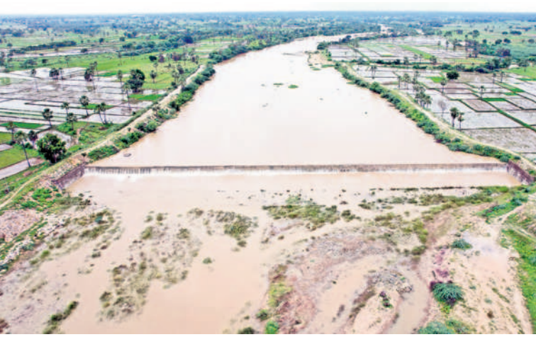
అలుగు పోస్తున్న దేవరపుల మండలం కడవెండిలోని చెక్ డ్యామ్ (ఫైల్)

సీఎం కేసీఆర్ సహకారంతో వాగులపై 28 చెక్ డ్యాముల నిర్మాణం