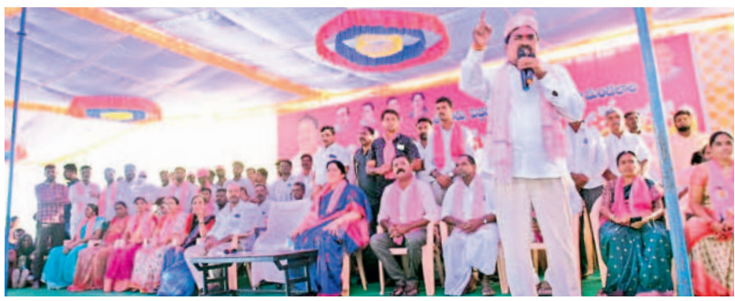
తొర్రూరులో జరిగిన గిరిజనుల ఆత్మీయ సమ్మేళనంలో మాట్లాడుతున్న మంత్రి ఎర్రబెల్లి దయాకర్ రావు