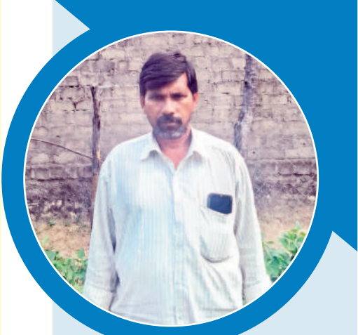
కాంగ్రెస్ వస్తే మళ్ళీ గోస పడుతం

పలిమెల: కాంగ్రెస్ పార్టీ అధికారంలోకి వస్తే మొదటగా గోస పడేది రైతులే. కాంగ్రెస్ గతంలో అధికారంలో ఉన్నప్పుడు రైతులకు ఏం మేలు చేసిందో అందరికీ తెలుసు. తెలంగాణ ప్రభుత్వం తీసుకువచ్చిన ధరణి పోర్టల్ ద్వారా మా భూములకు భరోసా కలిగింది. మా బోటలు వేలు ముద్రలు వేస్తే గాని పట్టణ మార్కెట్ కాపు. తెలంగాణ ప్రభుత్వం రైతులకు ఇస్తున్న పెట్టుబడి సాయంతో రైతులంతా ప్రశాంతంగా జీవిస్తున్నారు. కాంగ్రెస్ పోర్టల్ ధరణిని రద్దు చేస్తుంటున్నారని. పాత పద్ధతి మళ్ళీ వస్తే భూముల రికార్డులు తారుమారైతాయి. పట్టణ కోసం వీఆర్ఎల్ కు, ఎమ్మార్వోలకు లంచం ఇస్తే గాని పనులు కావు. కాంగ్రెస్ కల్లబోల్చి మోటారు నమ్మి ఓటేస్తే రైతుల పరిస్థితి ఆగమైతంది.