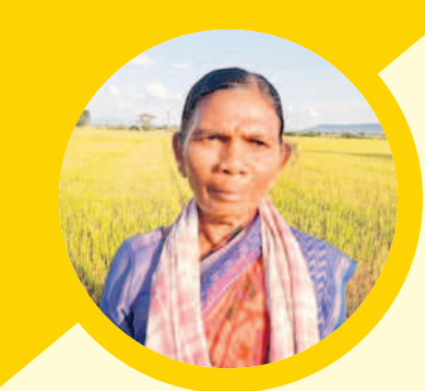
ధరణిలో వచ్చినప్పటి నుంచి రైతులందరి వత్తాంది

మంగలపేట : ఎన్నటి పట్టణ రైతుల కంటే గిప్పుడున్న ధరణి పద్ధతి బాగున్నది. నా భర్త చనిపోయినంత బోరునూపురం దగ్గర మాకున్న రెండేకరాల పొలం నా పేరు మీద ధరణిలో నమోదైంది. నా పేరు మీదికి భూమి వచ్చినంత రైతులందరి దరణిని ప్రశ్నించేసుకున్నాం. అప్పటి నుంచి వాసకాలం, యూసంగి సీజన్లకు కలిపి మొత్తం ఇరవై వేల రూపాయల రైతులందరి అర్థాంది. పంట పెట్టుబడికి ఇబ్బంది లేకుండా పోయింది. ఇంతకు ముందున్న సర్కారులో ఎవలు కూడా గిట్టే ప్రతి ఏడాది రెండు సీజన్లలో రైతులందరి ఇయ్యాలి. ధరణి వల్ల మా పొలాలు వేరేట్లకు మారే అవకాశం కూడా లేదు. ఈ పద్ధతి ఉంటేనే పొలాలు భద్రత ఉంటుంది. పంట పెట్టుబడికి రైతులందరి వత్తంది. ధరణిని ఎప్పుడో ఇట్టే ఉంచాలి. లేకపోతే రైతులు పట్టణ చుట్టూ తిరగాల్సి వస్తుంది. ధరణి తీసివేస్తే మోటారు అసలే వినం. ఇంత మంది పద్ధతి పెట్టిన కేసీఆర్ సర్కారు మళ్ళీ రావాలని కోరుకుంటానం.