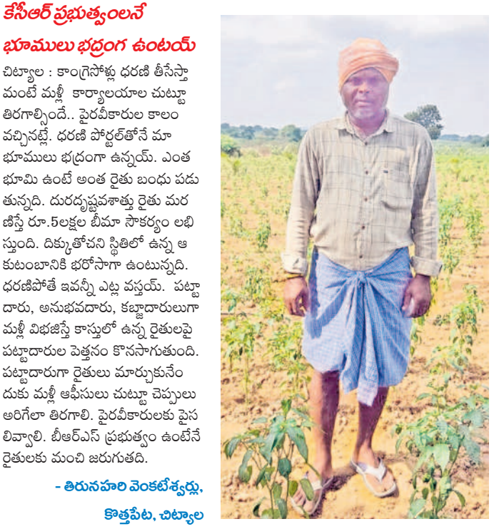
కేసీఆర్ ప్రభుత్వం అనే భూములు భద్రంగా ఉంటాయే

చిట్టాల : కాంగ్రెస్ పోర్టల్ ధరణి తీసివేస్తే మంచి మళ్ళీ కార్యాలయాల చుట్టూ తిరగాల్సింది. పైరడీకారుల కాలం వచ్చినట్లే. ధరణి పోర్టల్ తోనే మా భూములు భద్రంగా ఉన్నాయి. ఎంత భూమి ఉంటే అంత రైతు బంధు పడు తున్నాడు. దురదృష్టవశాత్తు రైతు మరణిస్తే రూ.5లక్షల టీమా సొంతర్లు లభిస్తుంది. దిక్కుతోపని స్థితిలో ఉన్న ఆ కుటుంబానికి భరోసాగా ఉంటున్నది. ధరణిపోర్టల్ ఇచ్చి ఎట్ట పన్నయ్యింది. పట్టణ దారు, అనుభవదారు, కల్పాదారులుగా మళ్ళీ విభజిస్తే కాస్తూర్ ఉన్న రైతులపై పట్టణదారుల పెత్తనం కొనసాగుతుంది. పట్టణదారు రైతులు మార్కుననే దుకు మళ్ళీ ఆపేసులు చుట్టూ చెప్పులు అరిగేలా తిరగాలి. పైరడీకారులకు పైస లివ్వాలి. బీఆర్ఎస్ ప్రభుత్వం ఉంటేనే రైతులకు మంచి జరుగుతుంది.