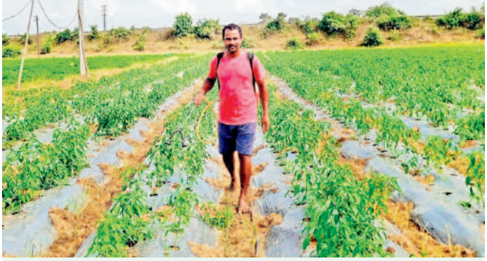
కాంగ్రెస్ వస్తే మళ్ళీ కష్టాలు మొదలైస్తే..

ఏటారూ నాగారం : తెలంగాణ ప్రభుత్వం దరణి పోర్టల్ తీసుకొచ్చిన తర్వాత పూర్తి దశాబ్ది వ్యవస్థ పోయింది. గతంలో అధికారుల చుట్టూ పట్టణ పుస్తకాల మార్కెట్ కోసం తిరగడం, లంచాలు ఇవ్వడం, రికార్డులు లేవని చెప్పడం జరిగింది. ఒక్కసారే కేసీఆర్ దరణి పోర్టల్ తో చెక్ పెట్టారు. రిజిస్ట్రేషన్లు, పట్టణ మార్కెట్ గంటలోపే పూర్తి చేస్తున్నారు. ఇది లేకుంటే రైతులకు కష్టాలు తప్పవు. మాన్యువల్ ఉన్నప్పుడు పహాణీలు, కాస్తు కాం, వారసత్వం అనే లింకులతో ఇబ్బంది పడేది. ఇప్పుడు అమ్మడం, కొనడం తేలిగ్గా అవుతున్నాయి. స్టాబ్ మెంట్ చేసుకున్నంత తొందరగానే పని పూర్తవుతుంది. ఇక రైతులు కార్యాలయాల చుట్టూ తిరిగిపోలేరు. డబ్బులు ఇచ్చేది లేదు. అధికారులు, కార్యాలయాల చుట్టూ రైతులు పడిగాపులు పడే రోజులు పోయాయి. అలాంటి రోజులను కాంగ్రెస్ మళ్ళీ తీసుకువస్తే రైతులను ఇబ్బంది పెట్టినట్లే. కేసీఆర్ ఉచితంగా కరెంటు కూడా రైతులకు ఇస్తున్నాడు. దీంతో ఎంతో మేలు జరుగుతోంది. మంచిచేసే వారికి మద్దతియ్యాలి.