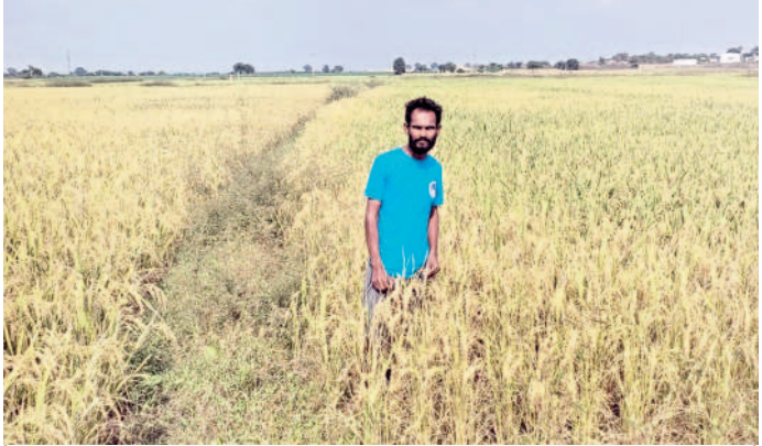
ధరణి తీసివేస్తే కాంగ్రెస్ మాకెందుకు..?

- నలకొప్పల వెంకటేశ్వర్లు, మిర్జాపేట, ఏటూరునాగారం