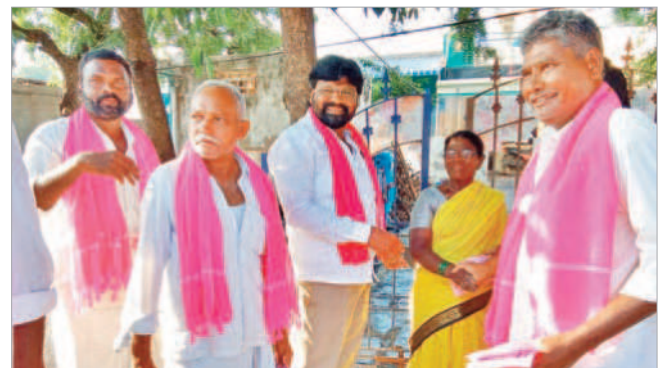
అయిజ ఎన్నికలలో ఇంటింటి ప్రచారం నిర్వహిస్తున్న బీఆర్ఎస్ నాయకులు