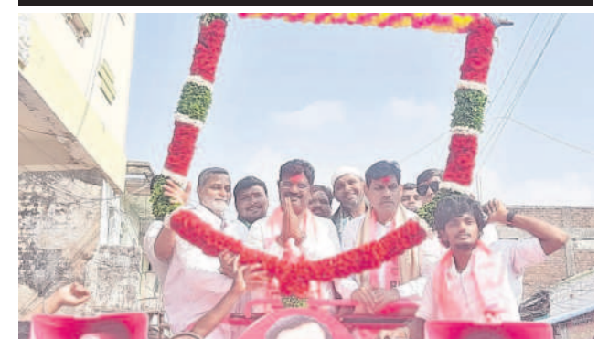
ఎమ్మెల్యే, ఎంపీని గజమాలుతో సన్మానిస్తున్న నాయకులు

• జుక్కల్ ఎమ్మెల్యే షిండే • బిచ్చంపల్లిలో ఎన్నికల ప్రచారం