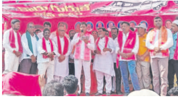
జుక్కల్లో మాట్లాడుతున్న ఎంపీ బీబీ పాటిల్