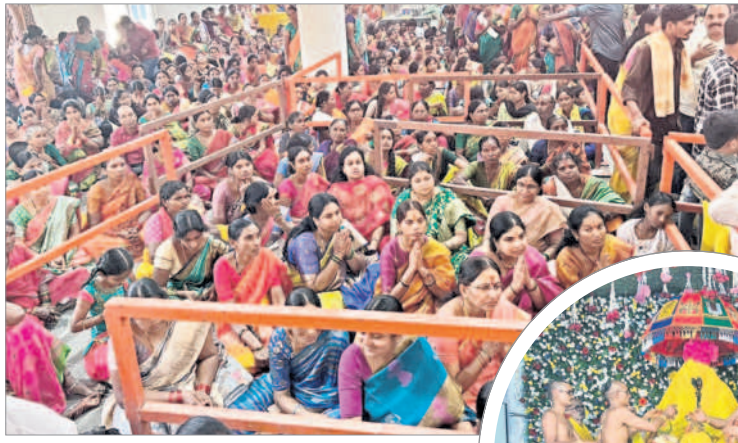
వేడుకకు హాజరైన భక్తులు