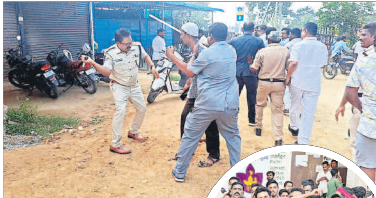
సాటాపూర్ గేట్ వద్ద లాఠీచార్జ్ చేస్తున్న పోలీసులు