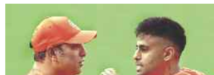
భారత్, ఆసీస్ తొలి టీ20 నేడు • సూర్యకుమార్ సారథ్యంలో బలోత్కి ప్రపంచకప్ తర్వాత మొదటి పోరు