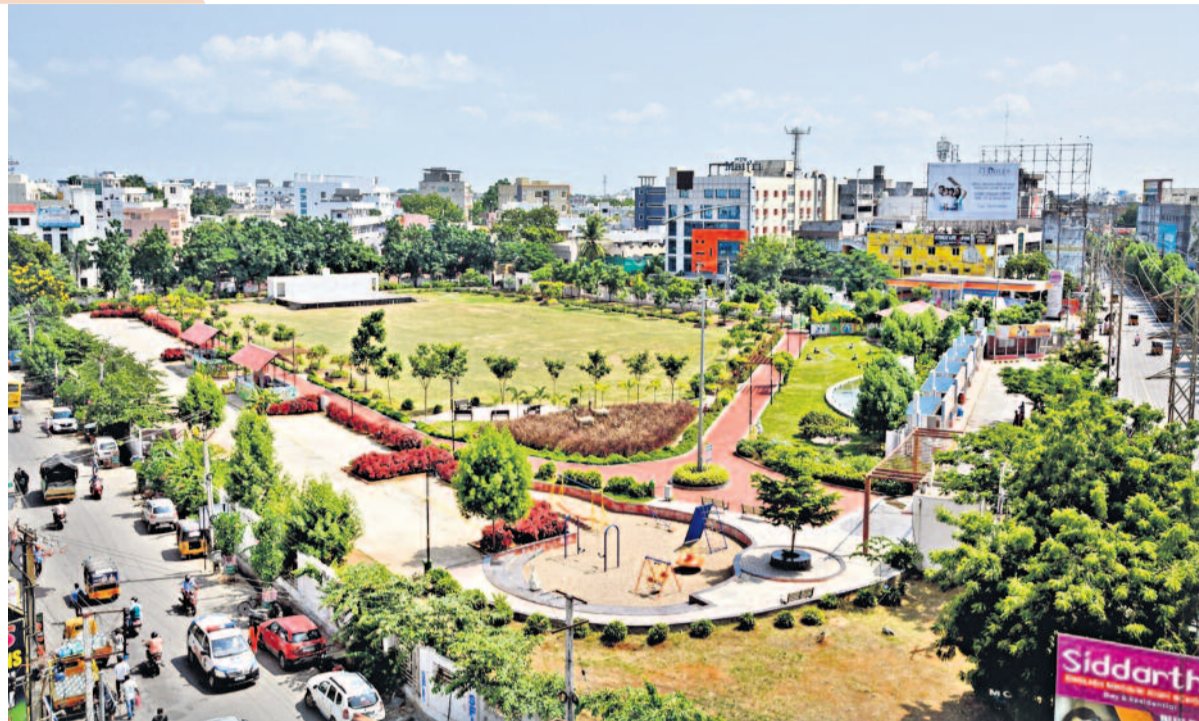
కేసీఆర్ ముఖ్యమంత్రి అయ్యాక కరంనగర్ నర్సరీ గ్రౌండ్ కి కొత్తరూపు వచ్చింది. రూ. 9.50 కోట్ల వ్యయంతో ఉద్యానవనంగా తీర్చిదిద్దారు. ఆట వస్తువులు, సింథటిక్ వాకింగ్ ట్రాక్, బెంబీలు, యోగాసెంటర్, మహిళలు, పురుషులకు వేర్వేరుగా టాయిలెట్స్ నిర్మించారు. సాంస్కృతిక ప్రదర్శనల కోసం వేదిక ఏర్పాటు చేశారు. ఇప్పుడు ఉభయ సంస్కర్తల సగరవాసులు గ్రౌండ్ లో వాకింగ్ చేస్తున్నారు. సాయంత్రం పూట పిల్లలతో వచ్చి కాలక్షేపం చేస్తున్నారు.