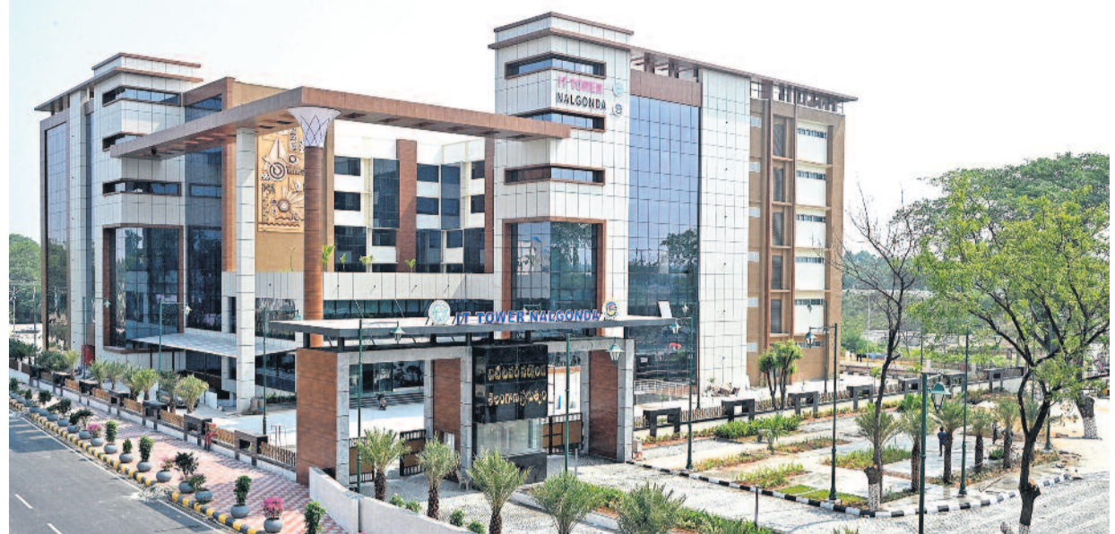
నల్లగొండలో నిర్మించిన వటి టవర్