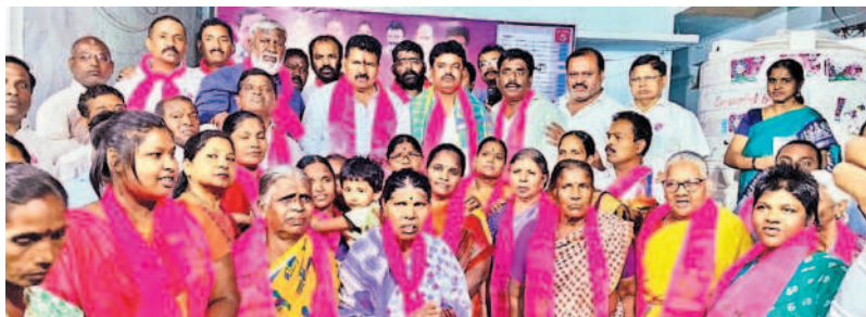
ఎమ్మెల్యే మూలా గోపాల్ సమక్షంలో బీఆర్ఎస్ లో చేరుతున్న యువకులు, మహిళలు