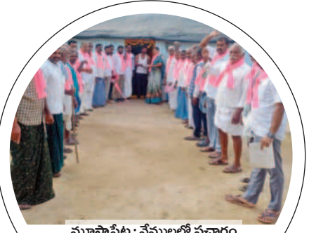
మూసాపేట : వేములలో ప్రచారం చేస్తున్న బీఆర్ఎస్ నాయకులు

మహబూబ్ నగర్, జడ్పీ, దేవరకల్ల నియోజకవర్గాల్లో బుధవారం బీఆర్ఎస్ నాయకులు ప్రచారంలో దూకుడు పెంచారు. ఎన్నికలు సమీపిస్తున్న నేపథ్యంలో విస్తృతంగా పర్యటిస్తున్నది. మహబూబ్ నగర్, జడ్పీ, హన్మండ్, రాజాపూర్, బాలానగర్, నవాబ్ పేట, మిడ్డల్ మండలాల్లోని ఆయా గ్రామాల్లో బీఆర్ఎస్ ఎమ్మెల్యే అభ్యర్థులు, నాయకులు, ప్రజాప్రతినిధులు సభలు, సమావేశాలు, ర్యాలీలు, రోడ్ షోల ద్వారా బిజీబిజీగా ఉన్నారు. బీఆర్ఎస్ చేసిన అభివృద్ధిని, పార్టీ మ్యానిఫెస్టోను ప్రజలకు వివరిస్తూ కారు గుర్తుకు ఓటు వేయాలని కోరారు. - నెలవర్క నమస్తే తెలంగాణ, నవంబర్ 22