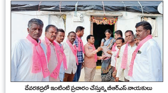
దేవరకల్లో ఇంటింటి ప్రచారం చేస్తున్న బీఆర్ఎస్ నాయకులు