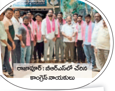
రాజాపూర్ : బీఆర్ఎస్ లో చేరిన కాంగ్రెస్ నాయకులు