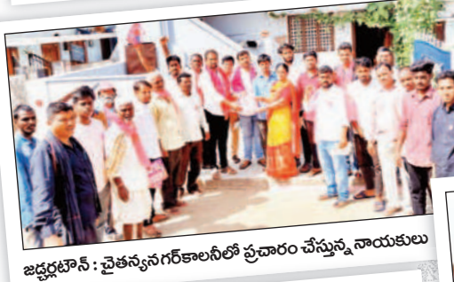
జడ్పీ అధ్యక్షుడు : చైతన్యనగర్ కాలనీలో ప్రచారం చేస్తున్న నాయకులు