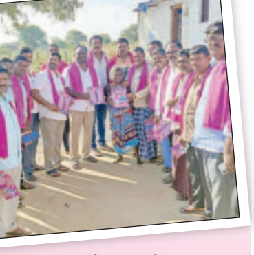
రాజాపూర్ : తిర్వలాపూర్లో ప్రచారం చేస్తున్న నాయకులు