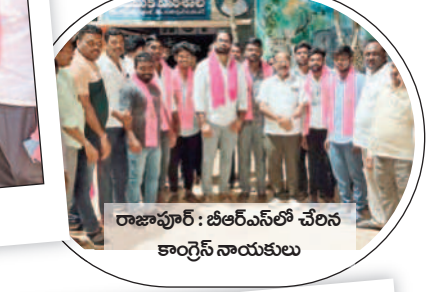
రాజాపూర్ : బీఆర్ఎస్ లో చేరిన కాంగ్రెస్ నాయకులు