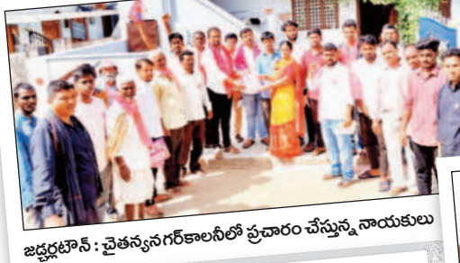
జడ్పీఐఐసీ : చైతన్యనగర్ కాలనీలో ప్రచారం చేస్తున్న నాయకులు