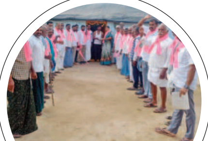
మూసాపేట : వేములలో ప్రచారం చేస్తున్న బీఆర్ఎస్ నాయకులు

మహబూబ్ నగర్, జడ్పీఐ, దేవరకల్ల నియోజకవర్గాల్లో బుధవారం బీఆర్ఎస్ నాయకులు ప్రచారంలో దూకుడు పెంచారు. ఎన్నికలు సమీపిస్తున్న నేపథ్యంలో విస్తృతంగా పర్యటిస్తున్నది. మహబూబ్ నగర్, జడ్పీఐ, హన్మండ్, రాజాపూర్, బాలానగర్, నవాబ్ పేట, మిడ్డల్ మండలాల్లోని ఆయా గ్రామాల్లో బీఆర్ఎస్ ఎమ్మెల్యే అభ్యర్థులు, నాయకులు, ప్రజాప్రతినిధులు సభలు, సమావేశాలు, ర్యాలీలు, రోడ్ షోల ద్వారా బిజీబిజీగా ఉన్నారు. బీఆర్ఎస్ చేసిన అభివృద్ధిని, పార్టీ మ్యానిఫెస్టోను ప్రజలకు వివరిస్తూ కారు గుర్తుకు ఓటు వేయాలని కోరారు. - నెలవర్క నమస్తే తెలంగాణ, నవంబర్ 22