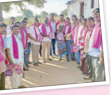
రాజాపూర్ : తిర్వలాపూర్లో ప్రచారం చేస్తున్న నాయకులు