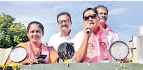
డోర్లకల్: చిలుకొక్కయలపాడులో మాట్లాడుతున్న ఎమ్మెల్యే