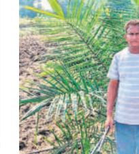
రాజు, యంపేట, పెద్దంపల్లి, టేకుమట్ల