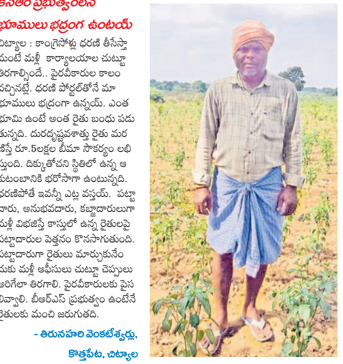
తీసుకోవాలి వెంకటేశ్వర్లు, కొత్తపేట, చిట్టాల్

దేశాన్ని దాదాపు 60 ఏళ్లు పాలించిన కాంగ్రెస్, రైతుల కష్టాలను ఏమాత్రం తీర్చిదిద్దాలని చూడలేదు. నాడు కరెంటు అప్పుడు వస్తేనే అప్పుడు పోతేనే తెలంగాణ పరిస్థితి. రాజకీయాలు చేస్తూనే పోయి పోయి పోయి పోయి... ఉండేలేని కరెంటు తొని పాతాళం తరువక అన్నింటా పంటలు అందజేసేయాలి.. అన్నా ఎట్లా మళ్లీ పోతే.. అంటున్నారు రైతులు. వ్యవసాయానికి కాంగ్రెస్ మూడు గంటల కరెంటు చాలాంటివని, మూడు గంటల కరెంటు మూడు మడులు కూడా తరువయని, అప్పు, అవునం తెలుస్తోన్నా ఇలానే మాట్లాడుతారని ఎద్దేవా చేస్తున్నారు. 10 హెక్టార్ల మోటార్లు కరెంటు అంతకావాలి.. ఇప్పుడు రైతుల పాతాళంలోకి 10 హెక్టార్ల మోటార్ల అవసరం పెట్టాలి అని ప్రశ్నిస్తున్నారు. అంతపెద్ద మోటారు పెడితే బోరు బావుల్లో ఊట ఉంటారని అడుగుతున్నారు. కాంగ్రెస్ వాళ్ల వల్ల కామె చేతుల్లో పైసలు లేక బక్కవస్తామని, తెలంగాణ ప్రభుత్వం వచ్చాకనే నాలుగు పైసలు కనవదుతున్నాయని చెబుతున్నారు. 24 గంటల కరెంటు తొని ఇప్పుడు రందిలేకుంటే అప్పుడు చేసే కుంటున్నామని, మళ్లీ పాతరైతులు వద్దని తెగిన చెబుతున్నారు. ధరణిని తీసిన భూమాతను తెస్తామని కాంగ్రెస్ పార్టీ అంటున్నారని, వాళ్ల తీరు చూస్తుంటే మళ్లీ దశాబ్దాల వ్యవస్థను తెచ్చి ఇంకా అధికారులు చూస్తున్నారని అర్థమవుతోందంటున్నారు. ఇప్పుడు ధరణిలో భూముల రిజిస్ట్రేషన్లు నిమిషాల్లోనే పూర్తవుతున్నాయని, చాలా సమస్యలు పరిష్కారమై నంతేమీ పథకాలు అందుతున్నాయని, ఇంత మంచి పోర్ట్ తొని తీసిన మాట్లాడుతారు పెట్టే పాత వ్యవస్థను తెస్తామని దండు పద్ధతుల ప్రశ్నిస్తున్నారు.