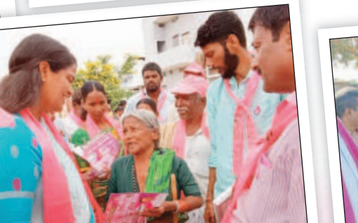
భూత్పూర్ కలెనలో ప్రచారం చేస్తున్న ఆల మంజుల