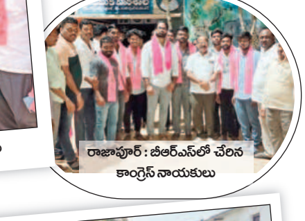
రాజాపూర్ : బీఆర్ఎస్ లో చేరిన కాంగ్రెస్ నాయకులు