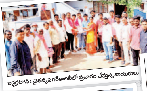
జడ్పీ టౌన్ : చైతన్యనగరకాలనీలో ప్రచారం చేస్తున్న నాయకులు