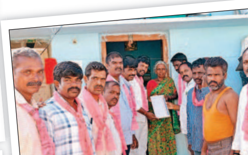
మూసాపేట : అడ్డాకులలో ప్రచారం చేస్తున్న బీఆర్ఎస్ శ్రేణులు