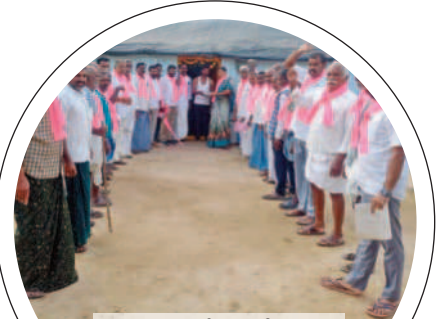
మూసాపేట : వేములలో ప్రచారం చేస్తున్న బీఆర్ఎస్ నాయకులు