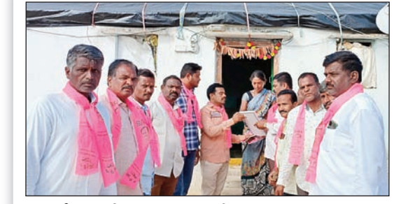
దేవరకల్లో ఇంటింటి ప్రచారం చేస్తున్న బీఆర్ఎస్ నాయకులు