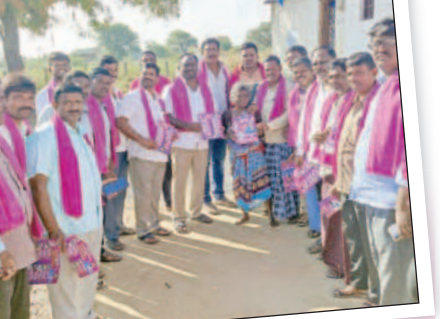
రాజాపూర్ : తిర్వలాపూర్లో ప్రచారం చేస్తున్న నాయకులు