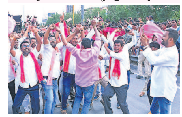
నేషనల్ హైవేపై నృత్యం చేసుకుంటూ రోడ్ షోకు వస్తున్న బీఆర్ఎస్ శ్రేణులు

• చౌటుప్పల్గులాజీమయం • పెద్ద ఎత్తున తరలివచ్చిన యువత