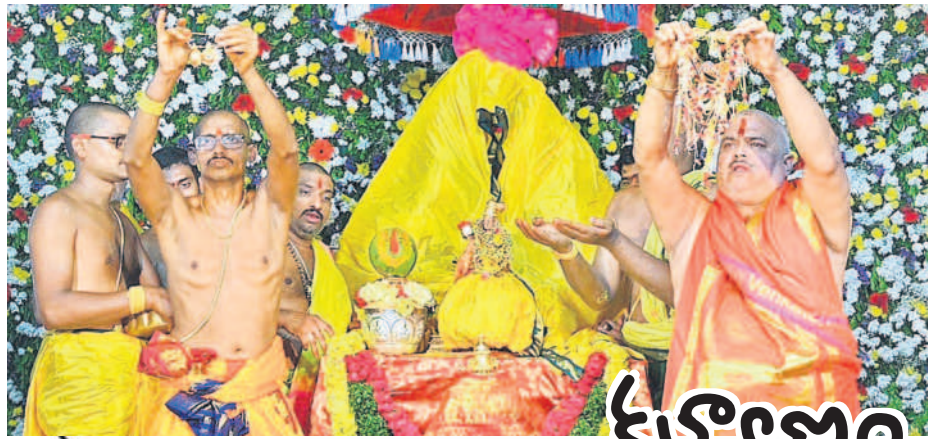
-వివరాలు 12 లో..