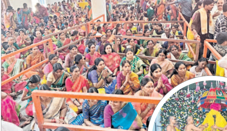
వేడుకకు హాజరైన భక్తులు