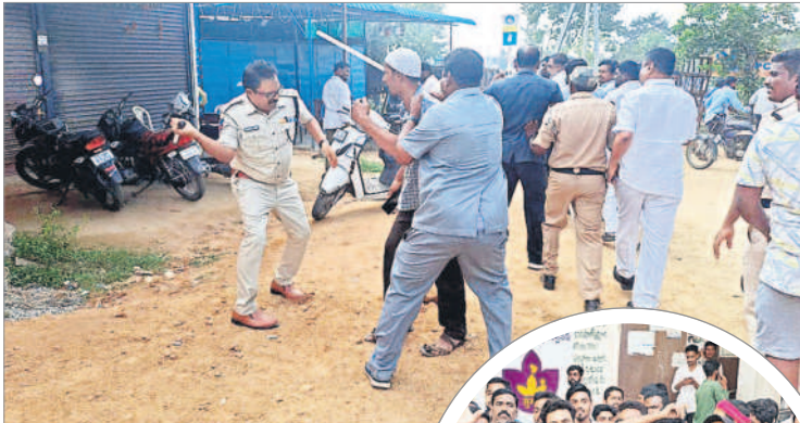
సాటాపూర్ గేట్ వద్ద లాఠీచార్జ్ చేస్తున్న పోలీసులు