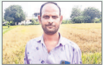
రేపంట్ల రెడ్డికి ఎవుసం గురించి ఎంతెలుసు?

- తార్కల వంశీ, రేగడిమర్లకుండ (సుల్తానాబాద్)