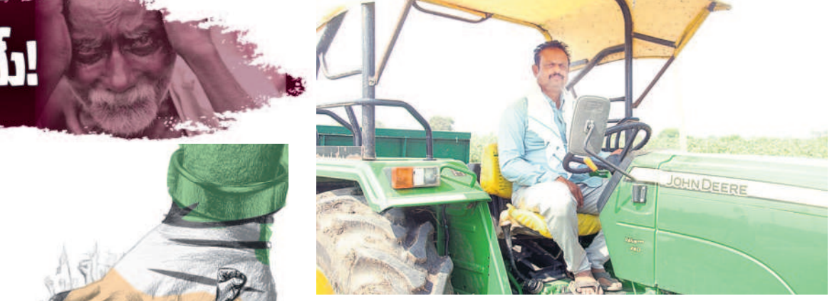
ధరణి తీసేస్తే పైరవీకారులు మళ్లీ తరు..

ప్రభుత్వం తెచ్చిన ధరణి పోర్టల్తో భూముల రికార్డులు భద్రంగా ఉన్నాయి. ఎప్పుడంటే అప్పుడు చూసుకోనే అవకాశం ఉన్నది. భూముల అమ్మకాలు, కొనుగోళ్లు అల్పంగా జరుగుతున్నాయి. రిజిస్ట్రేషన్ కాంగ్రెస్ పక్షం చూర్పాడి జరిగిపోతున్నది. ఎప్పుడంటే తేలికే పైస గూడ ఇవ్వాలి అంటున్నాడు. అంతా సాటిగా పూర్తవుతున్నది. మ్యూటీషన్ సైతం వెంటనే పూర్తవుతుంది. ఎలాంటి కిరికిరి లేదు. కాంగ్రెస్ ఉన్నప్పుడు భూముల మార్పిడి కోసం ఆఫీసుల చుట్టూ తిరుగుతున్నాడు. అప్పుడు అంతా గందర గోళంగా ఉండేది. మళ్లీ ఇప్పుడు ఓట్ల బ్రెంట్ రేపంట్ల రెడ్డి ఉన్న ధరణి తీసేసి కొత్తది తెస్తామంటూ పిచ్చి మాటలు మాట్లాడుతున్నాడు. కొత్తది తెస్తే పైరవీకారులు మళ్లీ తరు.. ఆయన వచ్చేదిలేదు. తెచ్చేది లేదు. రైతులందరూ తిరుగుబాటు తరిమిస్తే రోజు దగ్గరిలోనే ఉన్నాడు.