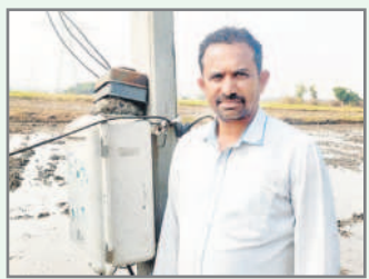
మూడు గంటలల్లో ఎకరం గూడా పారడం

పీసీసీ అధ్యక్షుడు ఎవుసానికి మూడు గంటల కరెంటు సాలంటున్నాడు. 10 హెక్టార్ల మోటార్లు పెట్టుకోవాలంటున్నాడు. దీంతో అధ్యక్షుడు అయిన కైతుల బాధలు తెలియదని. మూడు గంటల కరెంటుతో ఎకరం గూడా సర్కూ గా పారడం. ఇక పెద్ద మోటార్ పెట్టుకోవాలంటే రైతులందరూ ఖర్చుపాలు కాకవచ్చదు. ఒక్కో రోజు మీద లక్ష రూపాయల ఖర్చు పడుతుంది.