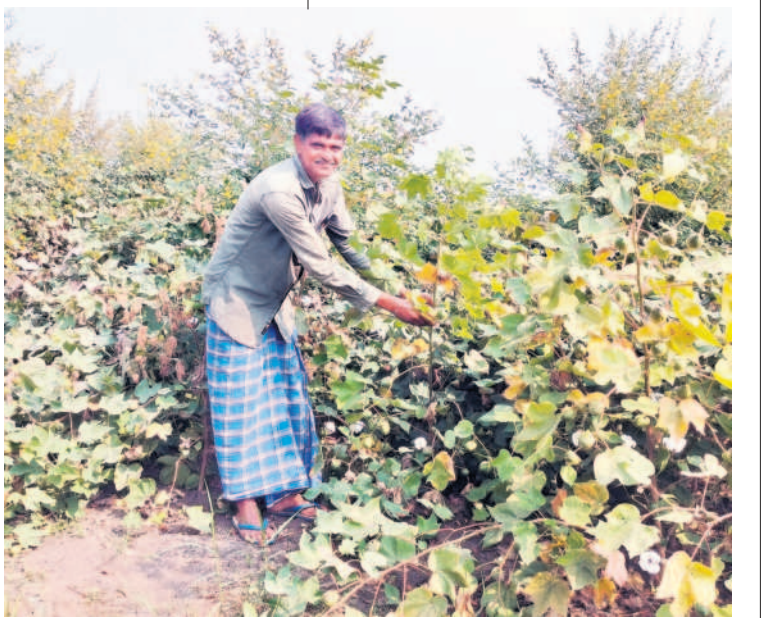
10 హెక్టార్ల మోటార్లు పైసలేవదని ఇతరు..

- గుంటూరు దేవాలయ రైతు, లంబాడికండా (డి.పి.ఎ)