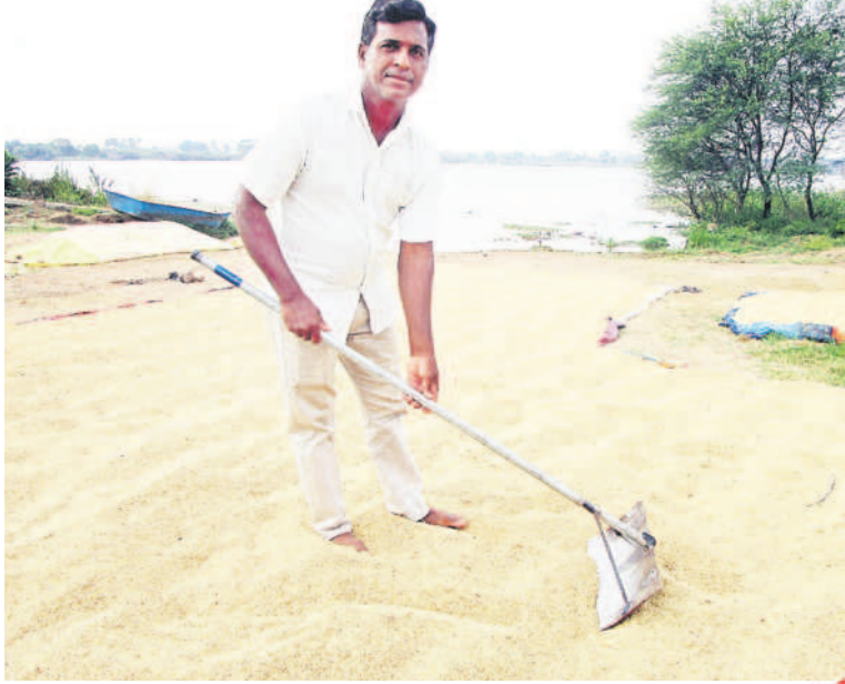
నిర్మల మాటలతో కాంగ్రెస్ కుట్ట తెలిసింది

- మామిడాల మార్కెట్, ఎన్టీసీ మల్లారా రైతు (జ్యోతిసగర్)