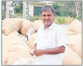
కాంగ్రెస్ గెలిస్తే కరెంటు కనుమరుగ్..