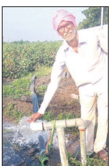
పెద్ద మోటార్ పెడితే