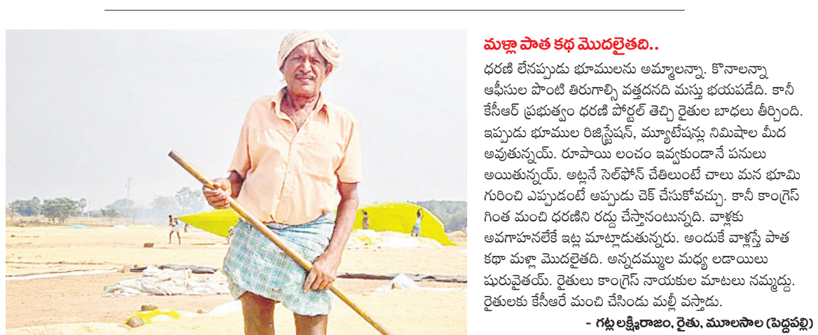
మళ్లీ పాత కథ మొదలైతంది..

ధరణి లేనప్పుడు భూములను అమ్మాలన్నా. కొనాలన్నా ఆఫీసుల పొలి తిరుగాల్సి వత్తడందే మన్న భయపడేది. కానీ కేసీఆర్ ప్రభుత్వం ధరణి పోర్టల్ తెచ్చి రైతుల బాధలు తీర్చింది. ఇప్పుడు భూముల రిజిస్ట్రేషన్, మ్యూటీషన్లు నిమిషాల మీద అవుతున్నాయి. రూపాయి లంచం ఇవ్వకుండానే పనులు అయితున్నాయి. అట్టే సెల్ ఫోన్ చేతిబుందే చాలు పనులు గురించి ఎప్పుడంటే అప్పుడు వెళ్లే చేసుకోవచ్చు. కానీ కాంగ్రెస్ గింత మంచి ధరణిని రద్దు చేస్తాంటున్నది. వాళ్లకు అమాహానకే ఇట్టే మాట్లాడుతున్నాడు. అందుకే వాళ్ల స్టే పాత కథ మళ్లీ మొదలైతంది. అన్నదమ్ముల మధ్య లడాాయిలు మరువైతయే. రైతులు కాంగ్రెస్ నాయకుల మాటలు నమ్మద్దు. రైతులకు కేసీఆర్ మంచి చేసింది మళ్లీ వస్తాడు.