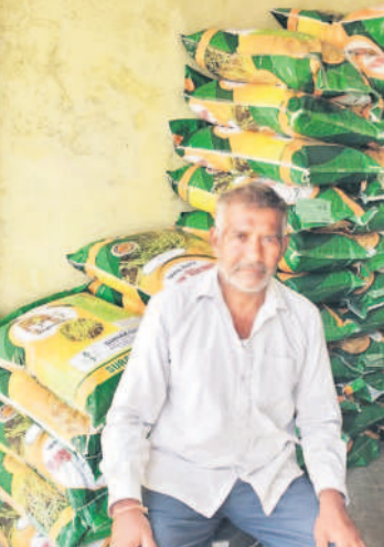
మోటారుకు మీటర్లు పెడుతారు.. ఉచిత కరెంటు లేకుండా చేస్తారు