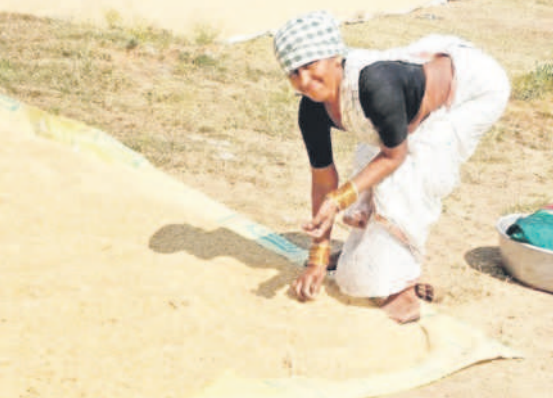
ఆ పాల్గొని నమ్మతే అగమైతం