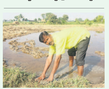
అప్పట్లో లింగోన పద్దం

తొమ్మిదేండ్ల కింద గింత మంచిగా కంటిడి ది. నీళ్ళక్కడియి. గింఁను సెరువు మంచిగిడి యివడతే సెరువు నిండ నీల్లొచ్చును. కరువుల గూడ ఎండిపోతుండ ఉన్నది. అందుకే బోర్లల్ల నీల్లొచ్చును. కడుపు నిండ కంటిలు గూడ ఇయ్యవడతే ఏడెకరాల వరే, పత్తి పంట పెడుతున్న ఇంతకు ముందు కంటిలు చక్కగ లేక. నీళ్ళ లేక రెండెకరాల వరే పెట్టే సాచిచ్చు కున్నం. ఇక కాంగ్రెస్ ఇచ్చే మామిడి గంటల కంటిలు ఏడ సపోతుంది. కంటిలు 24 గంటలుంటే తీరికచ్చుప్పుడు కంటిలు పెట్టుకుంటున్నం. ఇప్పుడే కంటిలు మంచిగిస్తున్నం. - మద్దుల రెండెండ్ల రైతు (అల్లారెడ్డిపేట)