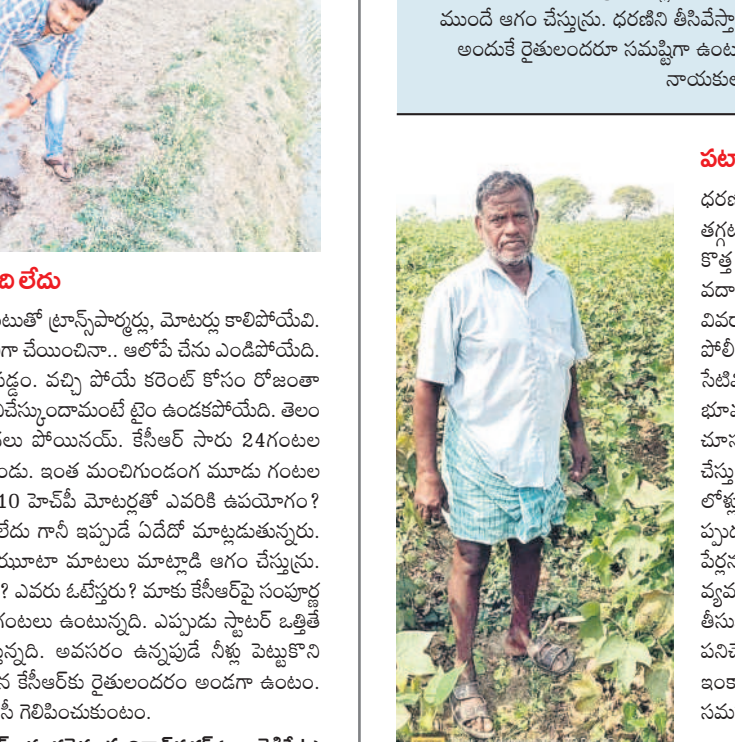
అ పార్టీని బంగాళాఖాతంలో కలుపుతం