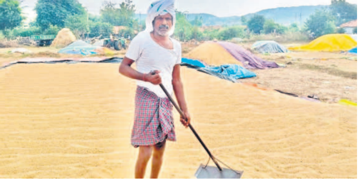
నాలీ గోసను మళ్ళీ మొదలైతయి