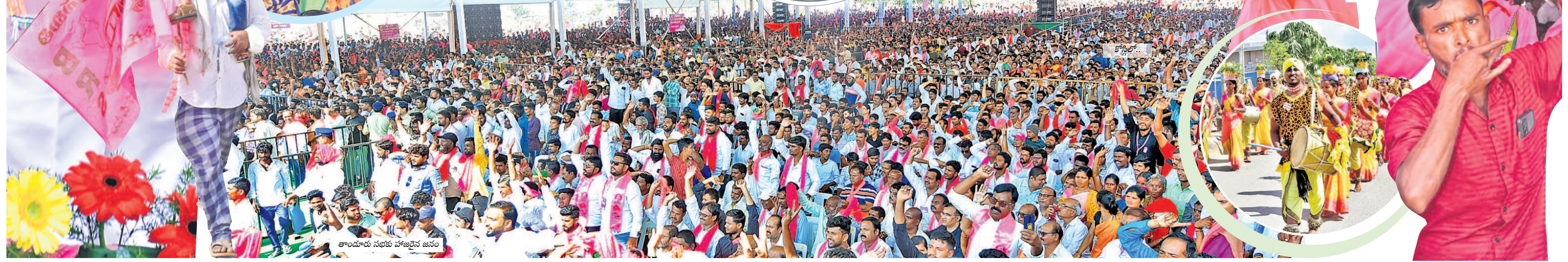
తాండూరు సభకు హాజరైన జనం