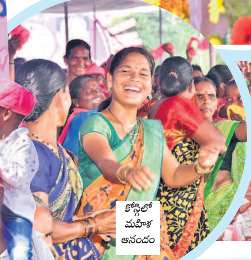
కోస్గిలో మహిళా ఆనందం