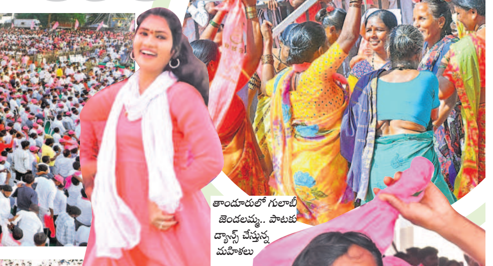
తాండూరులో గులాబీ బెండలమ్మ.. పాటకు డ్యాన్స్ చేస్తున్న మహిళలు