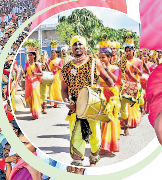
తాండూరులో గులాబీ బెండలమ్మ.. పాటకు డ్యాన్స్ చేస్తున్న మహిళలు