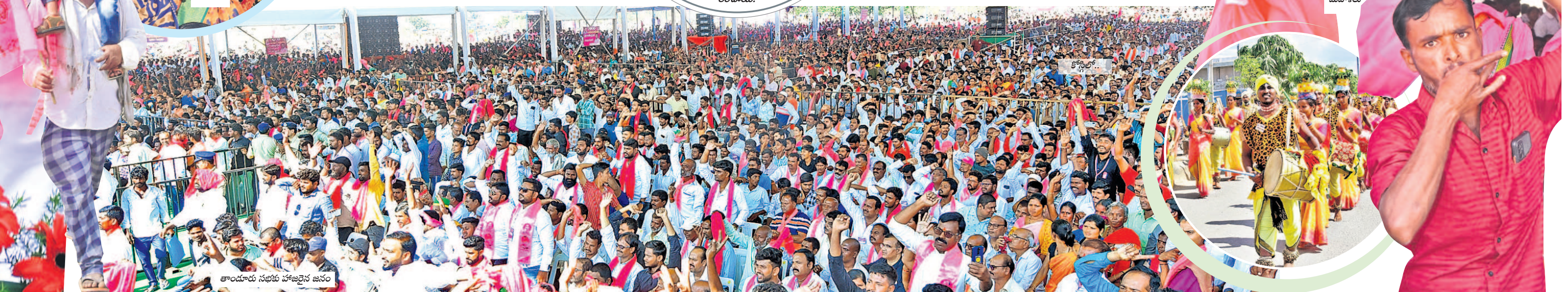
తాండూరు సభకు హాజరైన జనం