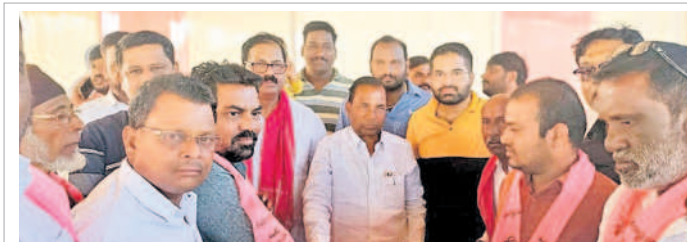
కోహిర్ : ఎమ్మెల్యే మాణిక్రావు సమక్షంలో బీఆర్ఎస్లో చేరిన కాంగ్రెస్ నాయకులు

కోహిర్ మండలం బడంపేట, కవేలి, మద్ది, నాగిరెడ్డిపల్లి