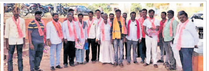
న్యాయకల్ : చాల్కి గ్రామంలో మాణిక్రావుకు మద్దతుగా ప్రచారం చేస్తున్న నాయకులు