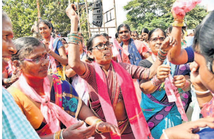
మిరుదొడ్డి రోడ్ షోలో డ్యాన్స్ చేస్తున్న వృద్ధురాలు