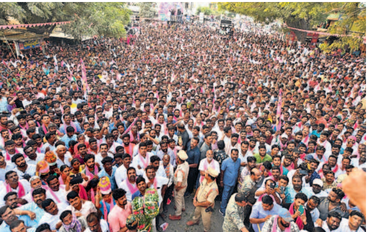
హనుమకొండ జిల్లా భీమదేవరపల్లి మండలం ముల్కనూర్ చౌరస్తాలో మంత్రి కేటీఆర్ రోడ్ షోకు హాజరైన ప్రజలు

దాదాపు పూర్తి కావబొంది. ఈ ప్రాజెక్టుతో లక్ష ఎకరాలకు సాగునీరు అందుతుంది. సీఎం కేసీఆర్ పేదల కోసం ప్రవేశపెట్టిన సంక్షేమ పథకం అందని గడపలేదు. ప్రతిపక్షాల మాయలో పడొద్దు. నన్ను