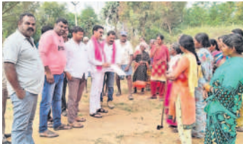
ముమ్మరంలో ఉపాధి కౌశలీను ఓటు అడుగుతున్న బీఆర్ఎస్ నాయకులు

ముద్దూరు(ధూళిమిట్ట), నవంబర్ 22 : మద్దూరు, ధూళిమిట్ట మండలాల్లో బీఆర్ఎస్ నాయకులు, కార్యకర్తలు ఎన్నికల ప్రచారం ము